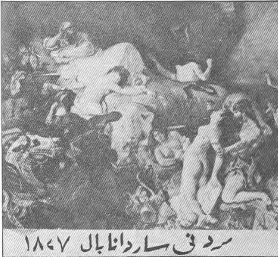
سردی سار دانا بال ۱۸۴۷

کیشاویه تی به کیکه لهو تابلویانهی که له ناوه پروکی چیروکیکی شاعیر بایرونه وه وهری گرتوه . کورتهی چیروکه که نه وه به که شاسار دانا بال پاش نه وهی تاخت وتارای له دست ده چیت و دوزمه کانی دست ده گرن به سهر وولاته که ی دا نم هه لدیت و فرمان ده دات دوی خوئی هه موو نه و شانه له ناو برین یان بگورین نه وه کو له پاش خوئی بینه مایه ی خوشی خه لکانیکی تر . نه وهی شایانی باسه هونه رمندی بلیعت دپلا کرو روخساریکی تازه گه ری دایه چیروکه که و شتیکی نویی خسته ناویه وه ، له تابلو که دا شاسار دانا بال له سهر جیگه که ی را کشاوه و ده روانته نه و قه سا بجانیه ی ده ورپشتی و به و پیری نارامیه وه بهی هیچ سله مینه وه به که ده ستی ناوه نه تژر سهری و پالی لی داوه ته وه . وه نه ییت دپلا کرو نه و شیوه تازه به ی که له تابلو که دا دیمان به ی هورده ناخنییه ناویه وه و به کاری هینایت ، به لکو نه وه خوئی له خوئی دا گه رانه وه به که بو تممنی مندالی که ناگر به ربیوه ژوروی نووسته که ی به ی نه وهی داوای یارمه تیه که بکات سهری نه و ناگره ی ده کردو فراموشی به یینی بلیسه که ی ده هات تاکو ناگره که زوری بو هیناو کراسه که ی هه ل لووشی .