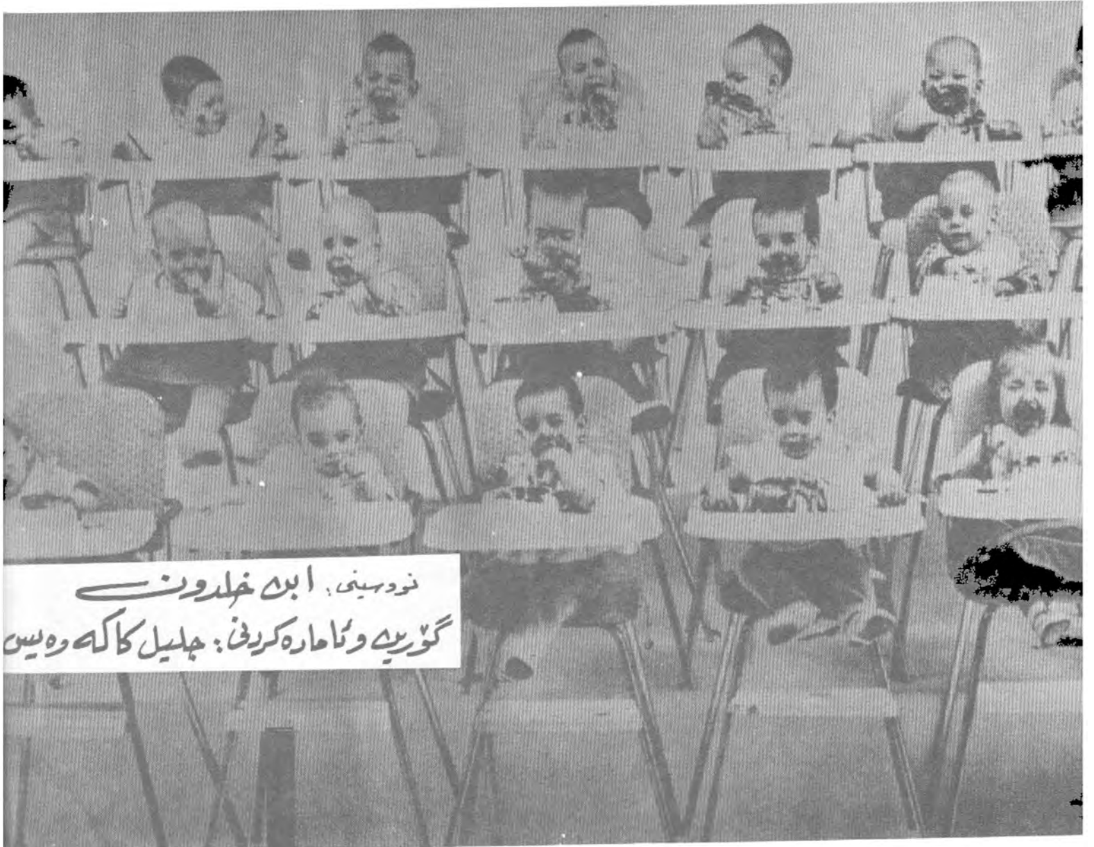
نورہینی، ابنہ خلدون گوریہ و نامارہ کرینی، جلیل کاکہ وہ سین