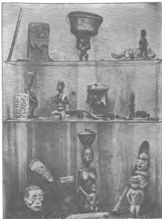
ٹاورنیک له کلتوری میللہ تانی ٹه فریقیا (موزه خانہ ی ٹه ٹونوگرافی لیبیراد .)

زورترین ژماره لهو ٹاره زوو مہندانہی که به شداری کوکردنہوی ہونہری میلی دہکن، وه کو ٹه ریگیایہی که ہنہندی ناموزگای یه کانی ٹه ٹونوگرافی له یه کیتی شورہوی و فلهندہ گرتیانہ بهر ٹه ویش به دروست کردنی چہند پیش برکی یه کی سالانہ که ہر یه کیک لہم پیش برکی یانہ تایہت دہبی به کوکردنہوی جوریکی دیاری کراو له فولکلورو کلتوری میلی، ہه زاران کہس به شداری ٹه پیش برکی یانہ دہکن، ہنہندی دہزگا، که بایہخ به کلتور دہدن چہند خه لاتیٹک ترخان دہکن بو سرکہ وتوہکان لہم ہوارہدا. له ریگیای ٹه پیش برکی یانہ وه دہستہ ییکی بلاو به ہموو ناوچہکان و بو کوکردنہوی ہونہری میلی و کلتور دروست دہبی، کوکردنہوی ریٹک خستی و پؤل پؤل کردنی ٹهم زانیاری یانہی که ٹه ٹاره زوو مہندانہ