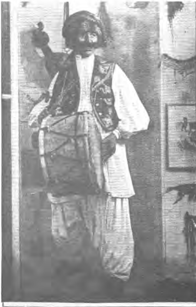
(دههول كوت) نمونونهيك بو كهلتووری روزهلات

زور هونهری میلی ههیه که تهنیا به نووسین و باس کردنی ناتوانین بیان پاریزین ههچهند نووسهر زور وردبین و بههیزی لهباس کردن دا ناتوانی وینهییکی تهواوی تم هونهره میلی به بگهیهنیه خونهر بی نهوهی پشت به وینهی فوتوگرافی یان سینهمایی بهستی. پیوسته پهنجه بو نهوه رابکیشین که تویرهی نهئوگرافی له کاتی وینهگرتن و زانیاری وهرگرتن دهبی پهچاوی خوورهوشت و داب و نهرتی کومهلایهتی نهو کومهلگایه بکات که لیکولنهوهی لهسهر دهکات و به هیچ جوریک ههستیان بریندار نهکات و له خزی دووریان نهخاتهوه، بو نمونه زور کومهلگا به هیچ جوریک رازی نابن که وینهی شوینه پیروزهکانیان، یان نافرتهکانیان بگیری. ههندی له زانایانی