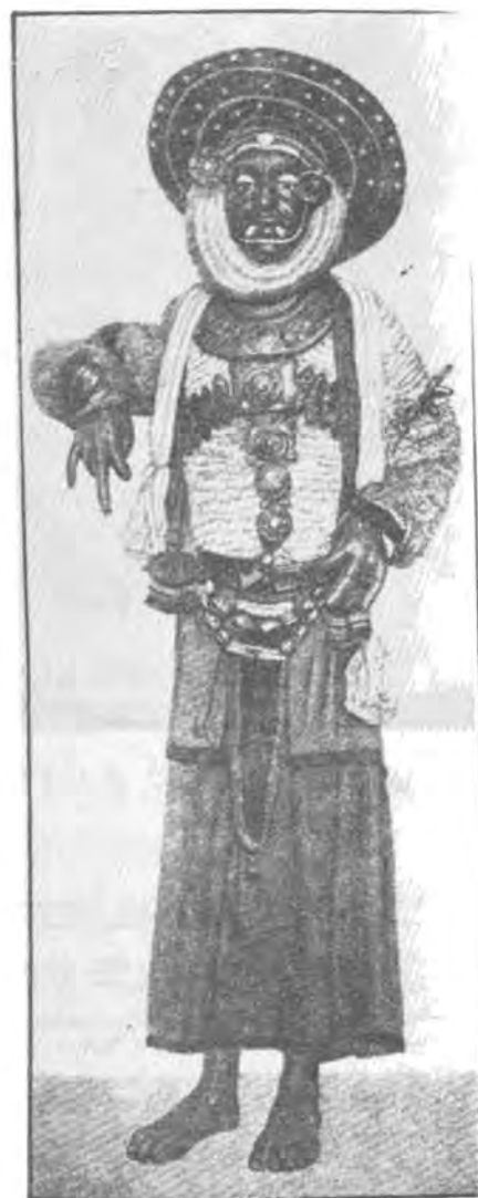
نمونه بهك بو كه لتووری هیندستان.