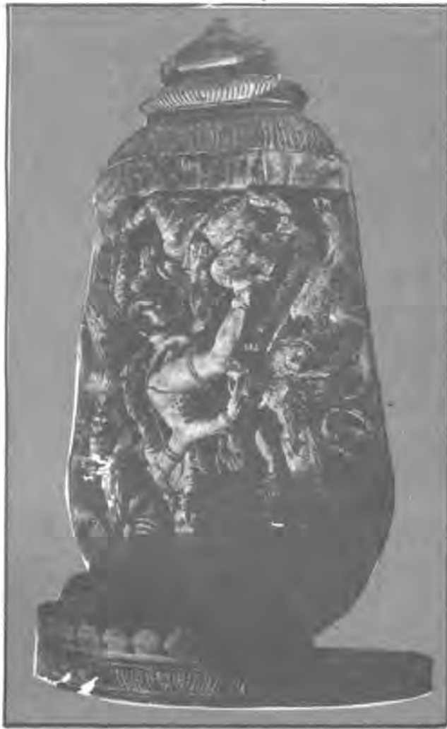
نمونه‌یهك بو كه لتووری خوارووی روزه‌لانی تاسیا

ئەو زانیاری‌یانەى كه توێزەر چنگى دە‌كه‌وتیت هیچ بایه‌خىكى نابێت ئە‌گەر سنووری كات و شوێن و بارى كۆمه‌لایه‌تى بو نە‌كیشابى، بۆیه پێ‌ويسته توێزەر بایه‌خ به كات و ساتى دە‌ركه‌وتنى پشه، یا هونەرە پشه‌سازى‌یه‌كه بە‌دات و ئاگادارى هه‌موو گۆرانە‌كان بێت له هه‌موو قوناغه‌كانى، تا ده‌گاته باشترین ئە‌نجام و پرووتترین شێوه، له‌لایه‌نى كۆمه‌لایىش توێزەر ده‌بێت به‌چاوى به‌كارهێنان و دروست كردنى پشه جوراوجۆره‌كان بكات، هه‌روه‌ها ده‌بێت تێبى جوراوجۆرى ئە‌و هونەرە پشه‌سازى‌يانە بكات له زۆر كۆمه‌لگای جیاوازا. ده‌بێت توێزەرى ئە‌ئوگرافى زۆر ئاگادار بێت له ئاراسته‌ كردنى