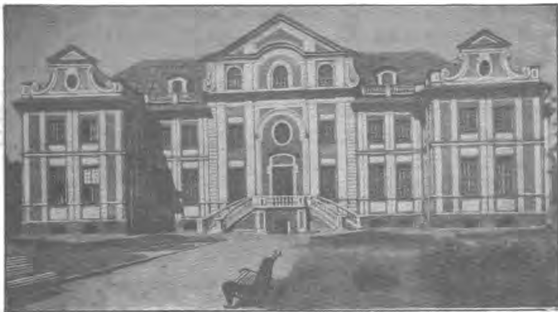
یه که م موزه خانه ی ئه شوگرافی له روسیایا (لینگراد - که ئیستا لینبیراده).

پاش وه ده ست هینانی ئه و زانیاری یانه ی که په یوه ندی به کولتور و هونری میلی کومه لگایه که وه هه به، تویره ری