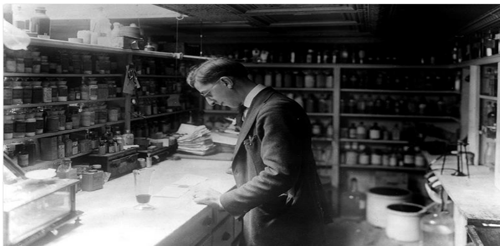
دەرمانسازیک له شاری واشنتون دی.سی

له کاتی ئهو پهتایهدا، خهلك بهلنشاو روویان له دهرمانسازهكان دهکرد تا بپره دهرمانیک بکرن، ههولیان دهدا چارهیهک بدۆزنهوه.