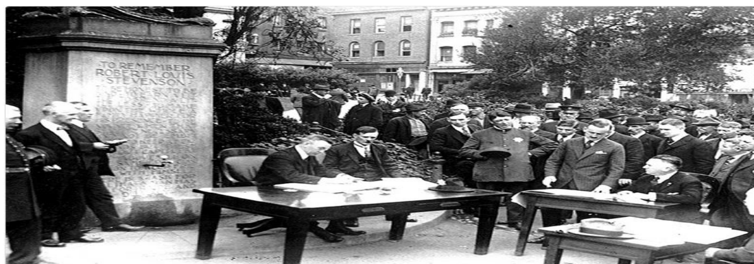
دادگای کراوهی پولیسی، شاری سانفرانسیسکو، ویلاپهتی کالیفورنیا

کریکاریکی پاکهروه له کاری کارکردندا دهمامکی بهستووه. مانگی تشرینی یهکهمی سالی ۱۹۱۸. کریکارهکانی پاکهروه وهک گورههلمکمنیش کاریان دهکرد تا قوربانایانی پهتایهکه بنیژن.