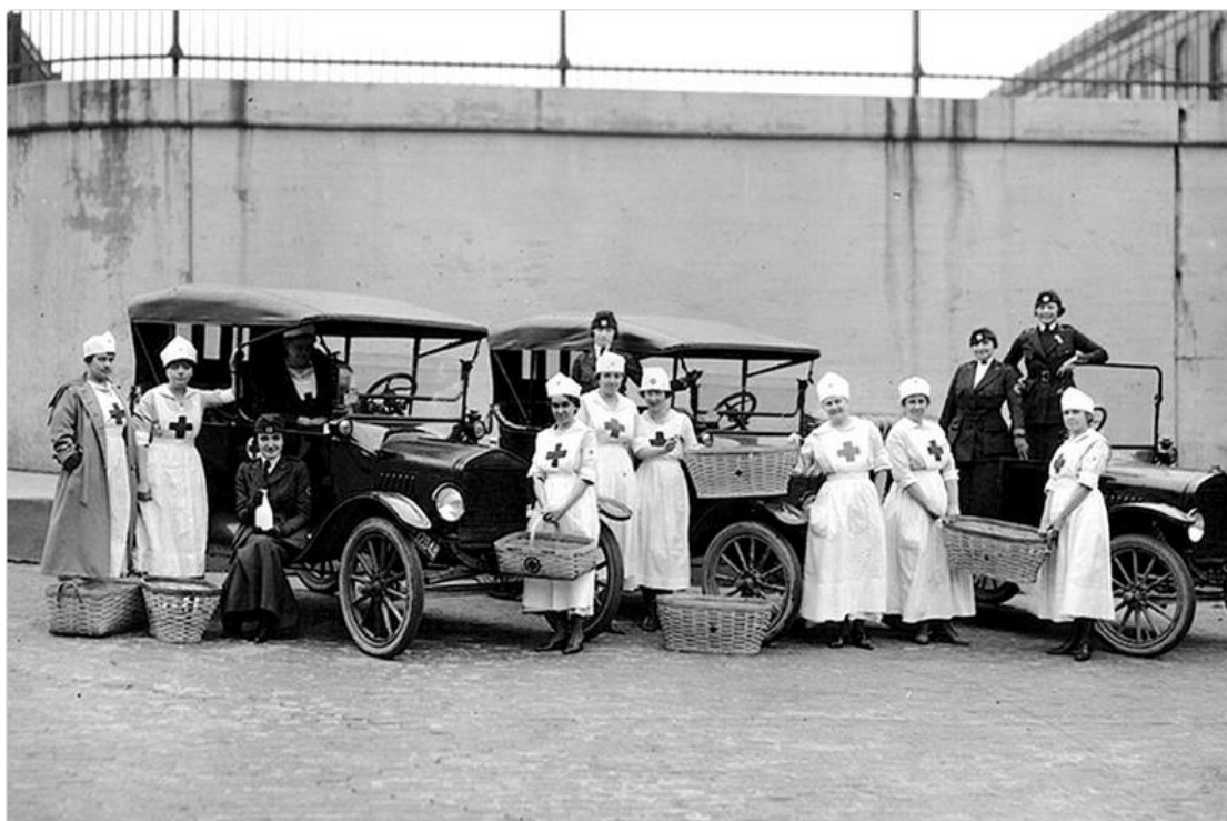
خۆبهخشانی خاچی سوور، شاری دیترویت، ویلیهتی میشیگان

له کاتی ئهو پهتایهدا، خهلك بهلنشاو روویان له دهرمانسازهكان دهکرد تا بپره دهرمانیک بکرن، ههولیان دهدا چارهیهک بدۆزنهوه.