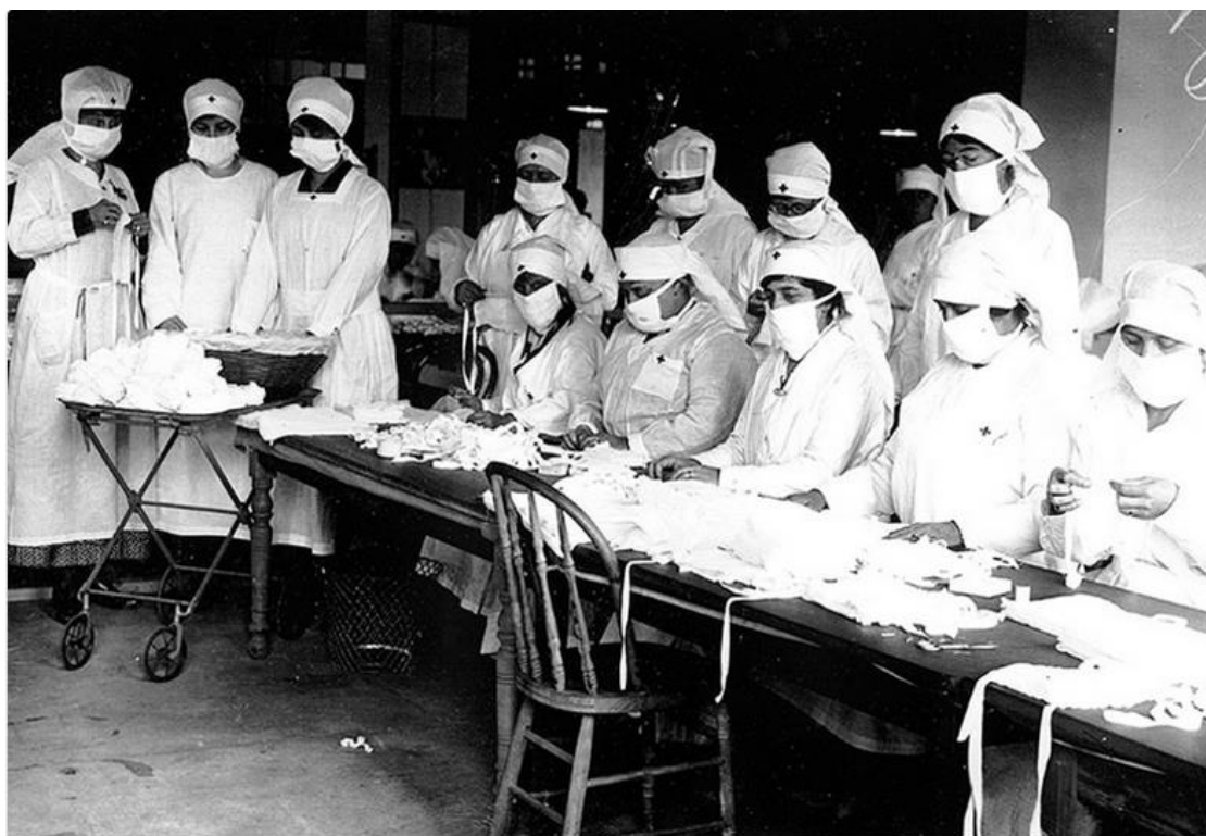
خۆبهخشانی خاچی سوور، شاری بۆستن، ماساچوستیس

ویلایهتی ماساچوستیس پزیشک و پرستاری لی برابوو بههوی ئهوهی بۆ خزمهتی سهربازیی بانگهئشت کرابوون. ههروهها چیدیکه بهشی پیویستی دهستهودایره بۆ پرکردنهوهی پیدایستی خهڵک بۆ چاودیری تهنرووستی له کاتی ئهم پهتا جیهانییهی سالی ۱۹۱۸دا نهبوو. مهککۆلی پاریزگار داوای لهکسانی کهتهی راهینراوی بواری پزیشکی کرد له سهرتاپای ویلایهتدا تا بین و بهرهنگاری ئهو پهتا جیهانییه ببنهوه. خۆبهخشانی خاچی سووری نیودهولتهی لهبۆستن دهمامکی هیلهکیی ئهو پهتایهیان بۆ بهکارهینان له کاتی توند بلاوبونهوهی له کامپی دیقینس له ویلایهتی ماساچوستیس نامادهکرد.