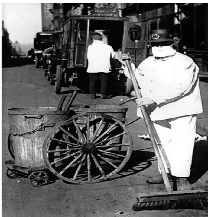
کریکاریکی پاکهروه لهشاری نیورک

کریکاریکی پاکهروه له کاری کارکردندا دهمامکی بهستووه. مانگی تشرینی یهکهمی سالی ۱۹۱۸. کریکارهکانی پاکهروه وهک گورههلمکمنیش کاریان دهکرد تا قوربانایانی پهتایهکه بنیژن.