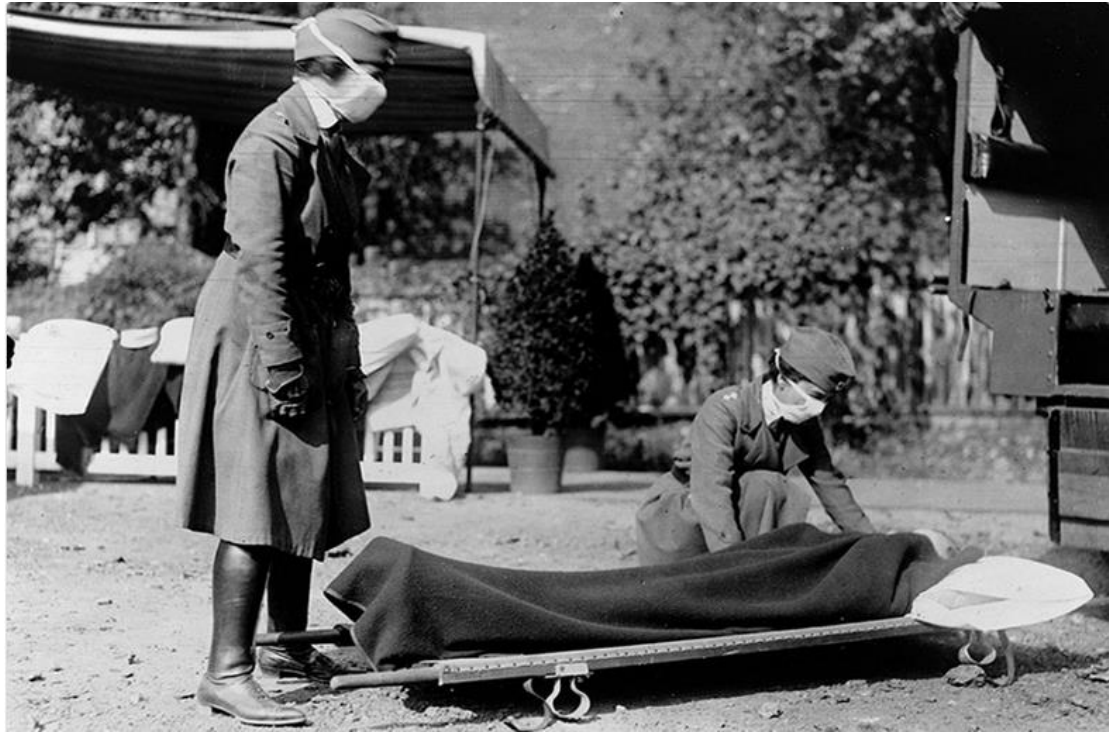
دیمه‌نی داربهستی خاچی سوور، شاری واشنتون دی.سی

دیمه‌نی ویستگه‌یه‌کی داربهستی فریاکهوتنی خاچی سوور له شاری واشنتون دی.سی له کاتی بلبوونه‌وه‌ی په‌تایه‌که. له‌گه‌ل ته‌شه‌نه‌سه‌ندنی په‌تایه‌که و زوربوونی ژماره‌ی تووشبووان، به‌په‌له په‌یوه‌ندی به‌پرستارانی راهینراو و خو‌به‌خشانی رانه‌هینراوانه‌وه کرد تا له‌مه‌ل‌بهنده‌کانی فریاکهوتن کاربکهن. له ۱۰ی مانگی تشرینی یه‌که‌مدا کۆنگرێسی ئەمریکا ب‌ری یه‌ک ملیۆن دۆلاری بۆ وه‌زاره‌تی تهن‌درووستی تهرخان کرد تا ۱۰۰۰ پزیشک و زیاتر له ۷۰۰ پرستاری ناو‌نووس کراو دابمه‌زرینن. له‌و کاته‌دا به‌شی پێویست پرستار نه‌بوو.