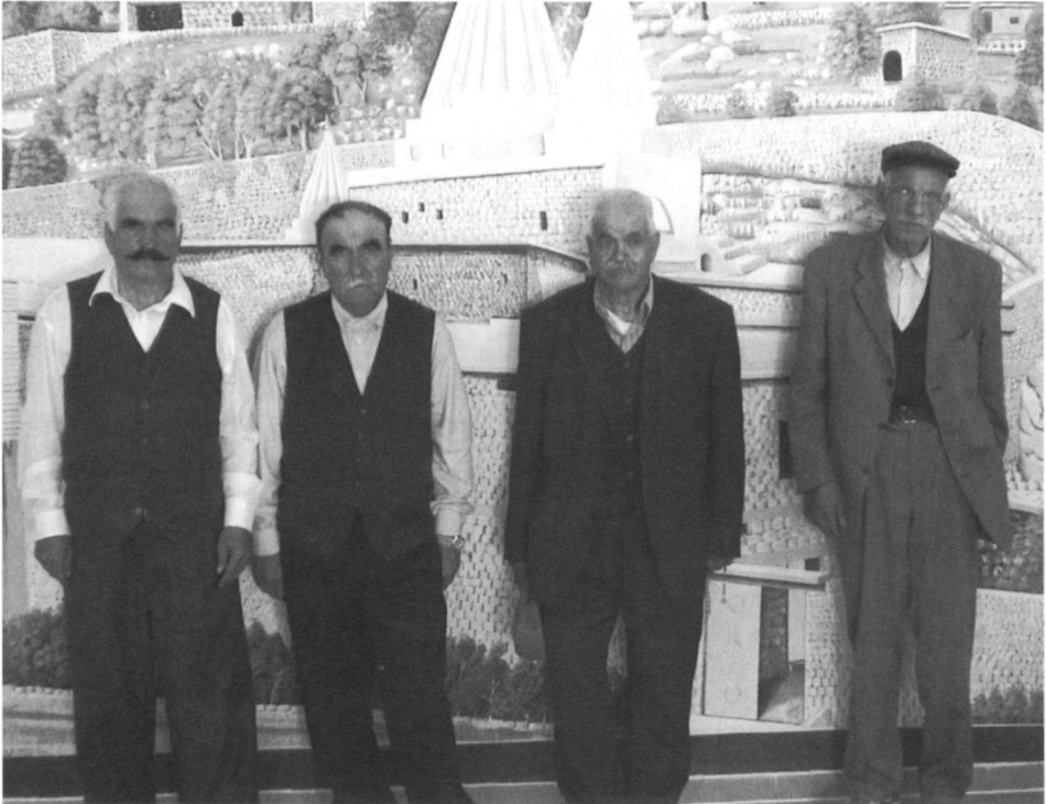
Abbildung 2: Besucher des Oldenburger Kulturzentrums vor Lalish-Wandbild

Zeremonien und Festen zur Schau gestellt und repräsentiert dann sozusagen den heiligen Ort. Zudem kursieren Videoaufzeichnungen vergangener Jahresfeste innerhalb der Gemeinden. Abbildungen vom Tal mit seinen Heiligtümern zieren Zeitschriftentitel, websites und Wände von Kulturzentren, vor denen sich Besucher fotografieren lassen und veranschaulichen so den Bezug der Diaspora zu ihrer ‚Heimat‘ (Abbildung 2).