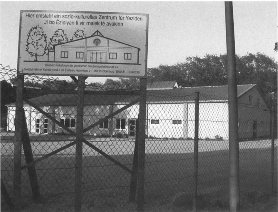
Abbildung 3: Yezidisches Kulturzentrum in Oldenburg

andererseits fordern Mirîdên, daß die Scheichs und Pirên die mit ihrer Stellung einhergehende Verantwortung ernst nehmen und sich um die ihnen Anvertrauten kümmern, anstatt lediglich die ihnen zustehenden Abgaben entgegenzunehmen.