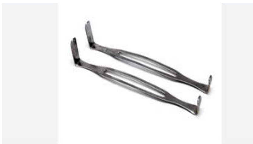
دوورخه‌هی سوپایی، ده‌ریایی