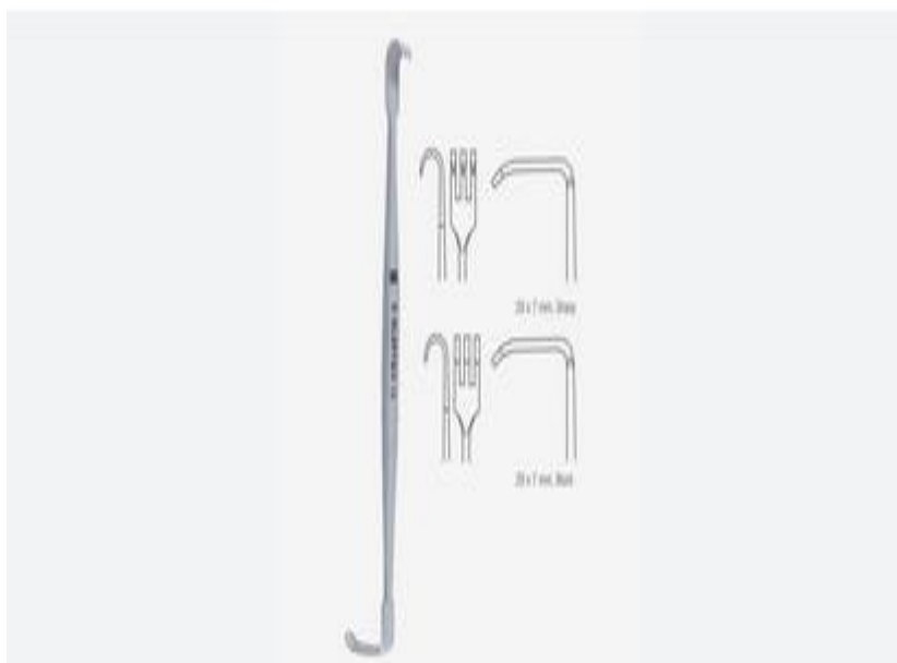
دوورخه‌هی سین میلیه، دوو سه‌ره