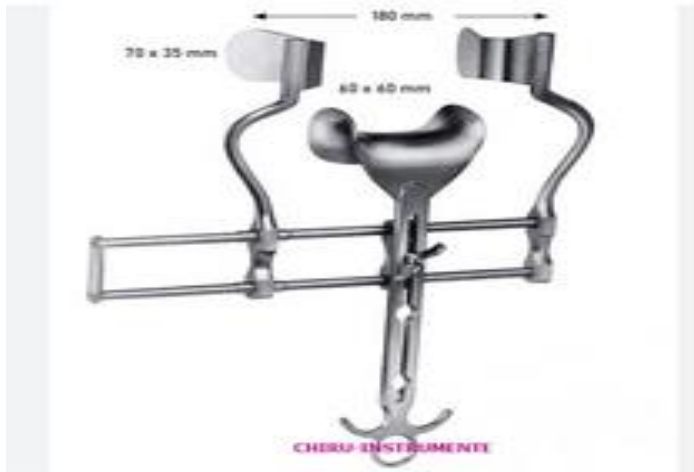
دوورخەرى بەلفۆر بۆ وىرگ