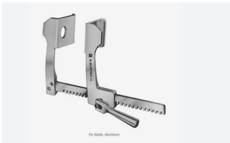
دوورخەرى فېنۆچىيەتو بۆ پەراسو