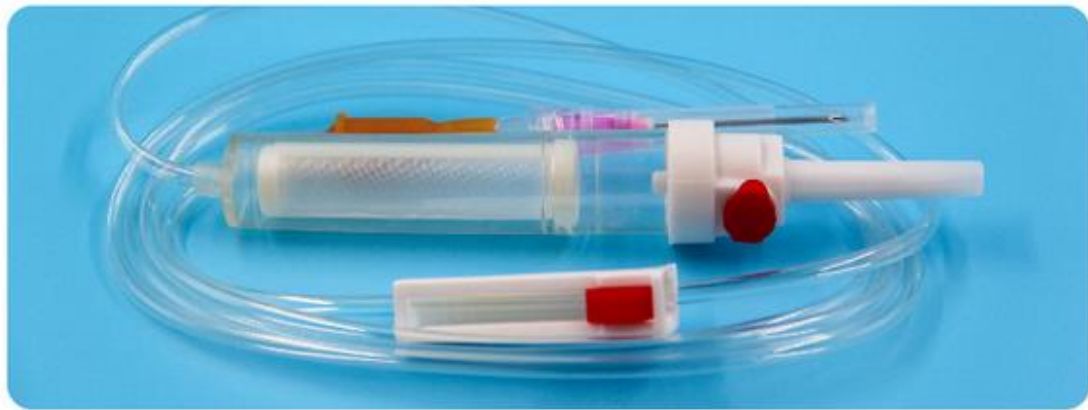
تاقمی خوین گواستنهوه

تاقمی خوین گواستنهوه بۆ گواستنهوهی خوینی جمانی ناو خوین هینهر و پیکهاتهکانی بهکاردههینریت. نهمهش کتومت گواستنهوهی خرۆکه سوورهکانی خوین و پهپکهی خوین (پلهیلیت) و پلازما دهگرینهوه. بۆ ئاسانکاری خوین گواستنهوه، کارمهندانی پزشکی بهستهی (پاکجی) خوینهکه زۆر به باشی لهسهروهوی نهخۆش ههلهواسن چونکه تاقمهکه به پینی هاتوچۆی هیزی کیش کردنی شله کاردهکات. سهریکی به شتیکی ئیژهوه دهبهستریت، که بۆ دندهانی جانتای خوینهکه بهکار دیت و سهرهکهی تریش دهرزی ژیر پیستی پیوه دهنوسیت. دواتر دهرزییهکه بهناو خوینهینهری نهخۆشهکهدا دهردریت.