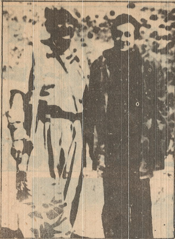
د. که مال خوشناو