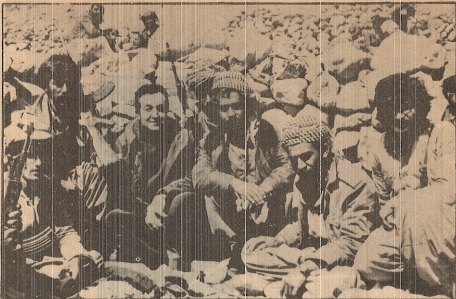
د. که مال خوشنار شهید نازاد هورام حامد حاجی عالی