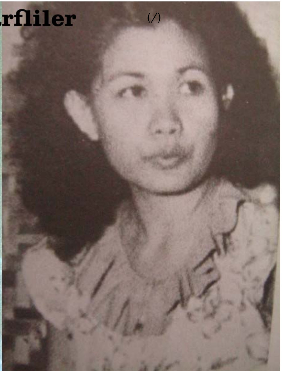
6. Lucía Topolansky