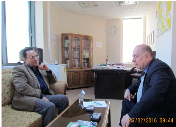
نازاد عهبدولواحید - سهعدوون یوونس

پامان: سه رهتا به خیرهاتنت دهکین بۆ سازدانی ئەم هه قهه یقینه.