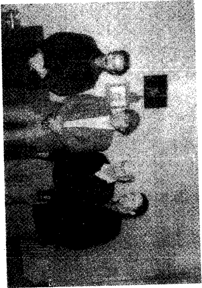
نه ندرزيار چه سه ني خانم هي - هه ژار - هيبي . صارفاخا