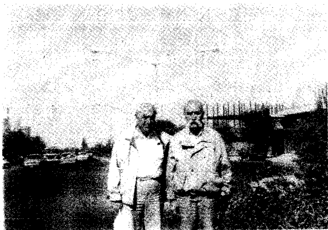
هیدی .. دوکتور چه سه نی حیسامی ته وریز - ۱۹۹۰ زاینی