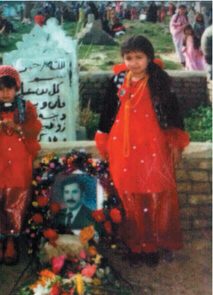
هەرەوێز، بوێر و هەریار، جگەرگۆشەکانی شەهید لە چەلی باوکیاندا، گۆرستانی سە