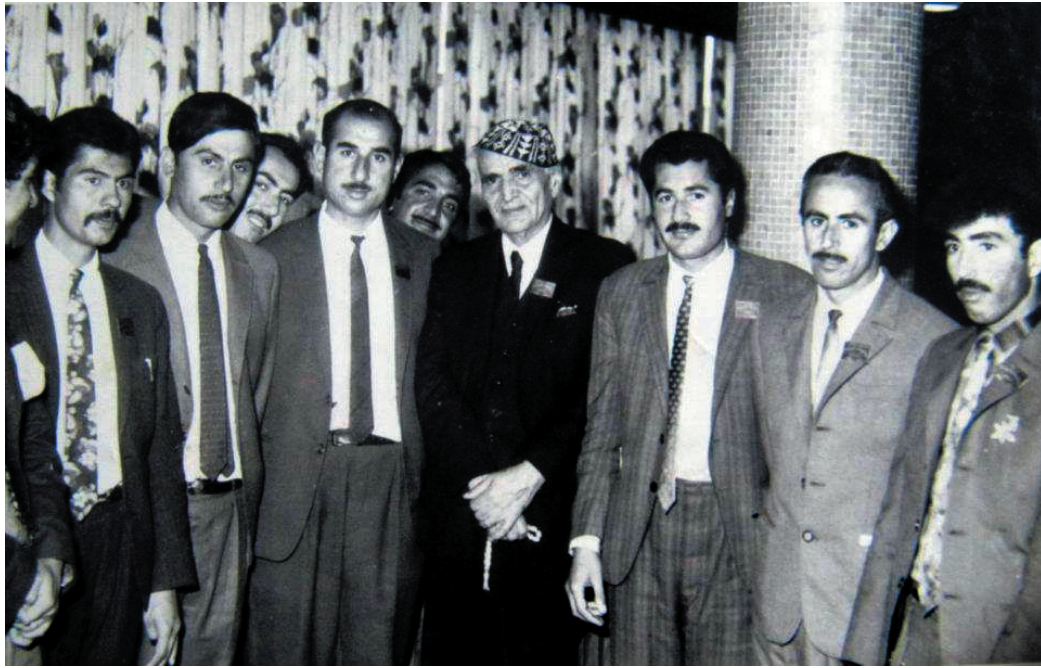
لە راستەو: ئەناسراو، ئەناسراو، شەهید جەمیل رهنجبەر و شاعیری ناواری عێراقی محەمەد مەهدی جەواھیری (١٩٧٠)