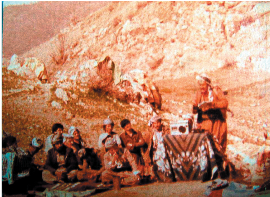
شهید جمیل ره‌نجبر له مراسیمی دهرچوونی خولی کادیران و دوهم سالپوژی شهیدبوونی (شهید نارام) دا ئه و شیعره ده‌خوینیتته‌وه که بق شهید نارامی نویسیوو، (۱۹۸۰/۱/۳۱) ناوزه‌نگ