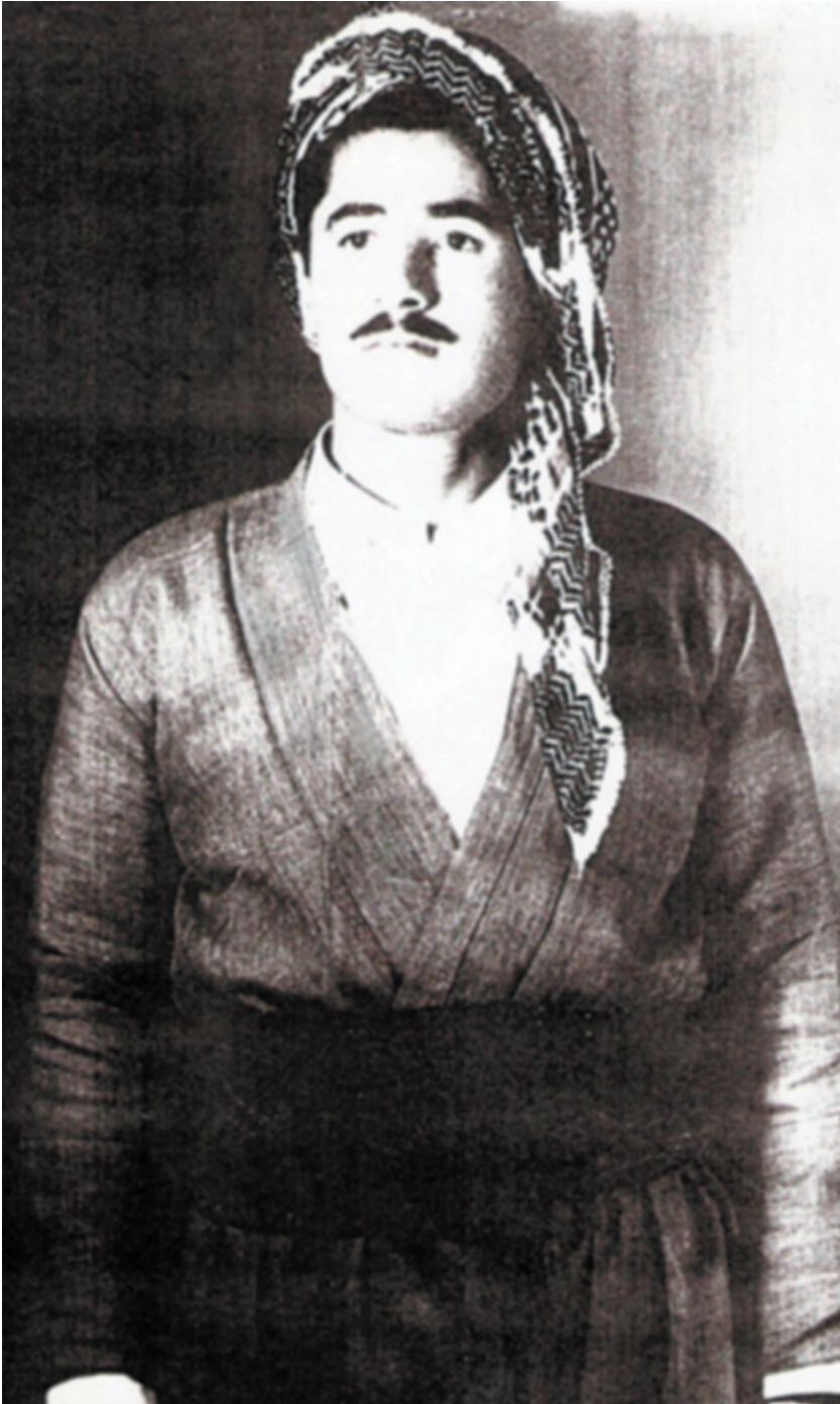
شاعری شهید ماموستا جمیل ره‌نجبر (۱۹۴۷- / ۱۷ ۱۸ / ۱۹۸۰)