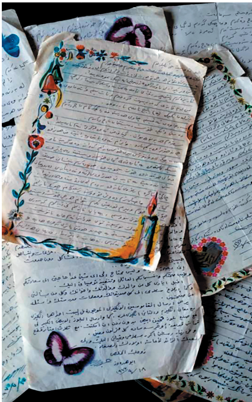
نمونه‌ی چند نامه‌ی که شهید جمیل ره‌نجبر له زندانه‌وه بق سعادته خانمی هاوسه‌ری، سالانی هفتاکان