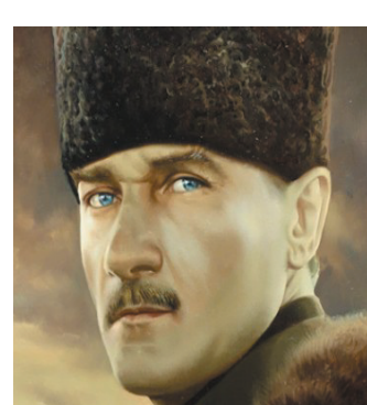
مستفا کهمال ئه اتورک