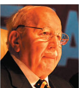
نهجه دین نهره کان