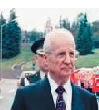
کهنان نه فرین