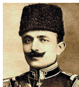
ئه نوهر پاشا