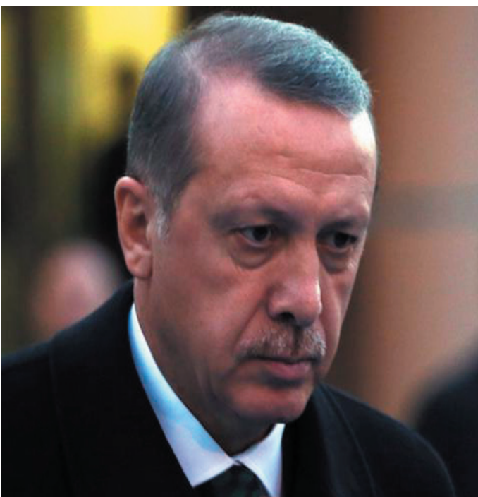
رەجەب تەيب ئەردوغان

بەپىتى قۇقارى ئىكۆنۆمىستى وھزارەتى دەرەوھى ئەمرىكا بىت، ئىستا كەمىنەى (ناموسلمان) كەمتر لە ۸ى ۸۰ مىلۆنى دانىشتوانى توركيا پۆگرتىت؛ ۹۰ ھەزار ئەرمەنى، ۲۰ ھەزار رۆمانى كاسۆلك، ۲۳ ھەزار جوولەكە و ۲۵ ھەزارىش يۇنانى ئۆرۆدۆكس . ئەم كەمىنە ھىچ كارىگەرىيەكان لەسەر برىارى سىياسى لە ولاتدا نىيە . ھەر لەدواى دامەزراندنى كۆمارى توركيا و نووسىنەوھى يەكەم دەستور لە سالى ۱۹۲۴، ھىچ شۆپىنك بۆ كەمىنەكان لەناو توركيا ديارى نەكرا، لە بەندى ۸۸ى ئەو دەستورەش دەلى: "ھەموو دانىشتوانى توركيا بەپىت جياوازى ئايىن و پەگەز، تورك . " ھەرچەندە لە ۱۰ى ئابى ۱۹۲۰ پەيماننامەى سىفەر دەولەتتىكى ئەرمەنى و ناوچەيەكى ئۆنۆمى بۆ كورد ديارى كەردبوو؛ بەلام لە ۲۴ى تەموزى ۱۹۲۴ پەيماننامەى لۆزان ئەمەى ھەلۆھەشاندەوھە .