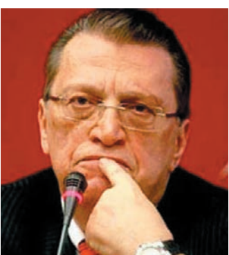
مهسعود به ناماز