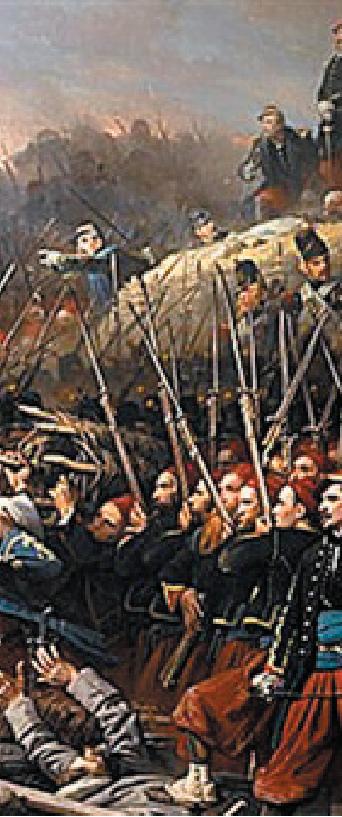
شەری عوسمانی و روس

فەرغە سیاسییە وای کرد که شێخانی تەریقەت رۆژێکی زۆر گەرم بێنن، بەتایبەتیش ئەو کات بارودۆخی کورد لەو پەڕی ناخۆشیدا بوو، دەولەتی عوسمانی دوو شەڕی سەختی لەگەڵ روسیای قەیسەری کردبوو لەسالی ۱۸۵۲ و ۱۸۵۶ شەڕی قەرمی پێدەگوتری لەسالی ۱۸۷۷ و ۱۸۷۸ ییش ئەم دوو شەڕە وای کردبوو لە کوردستان نا ئارامییەک و ناخۆشییەکی زۆر بۆلابوو بوو، بەتایبەتیش وای لە کورد ئەسەند، تەنانەت وای لێهات، سالی دوو جار باجیان لە کوردەکان دەسەند، جگە لەوەش نا ئاگان و سەرۆک عەشیرەتەکانیش باجیان لە کورد ئەسەند، تا وای لێهات شارێ دیلمان بوو بوو مەلەبەندێک بۆ فرۆشتنی مندالی کورد، لەسالی ۱۸۷۹ وای لێهات خەلکی لە برسا ئارامی نەما بوو، لەگەڵ ئەوەش دەستی بەسەر ورگی خۆی دادەنا و دەگەڕا و دەیکوت مەن برسیمە، سالی ۱۸۷۹ ناوی لێنرا بەسالی ئەمەن برسیمە، ئینجا لەو کاتەوە شێخ عوبەیدوللا تەکیبەکی کردبوو وە بۆ ئەو کوردە لێقە و ماوانە و رۆژانە دووسەد تا پێنج سەد کەس سێ ژەمە لەوێ نانیان لە تەکیبەکی شێخ عوبەیدوللا دەخوارد و لەبەر هەندیک هەر لەوێ نازناوی باوکی کورد بە شێخ عوبەیدوللا نەهێرا.