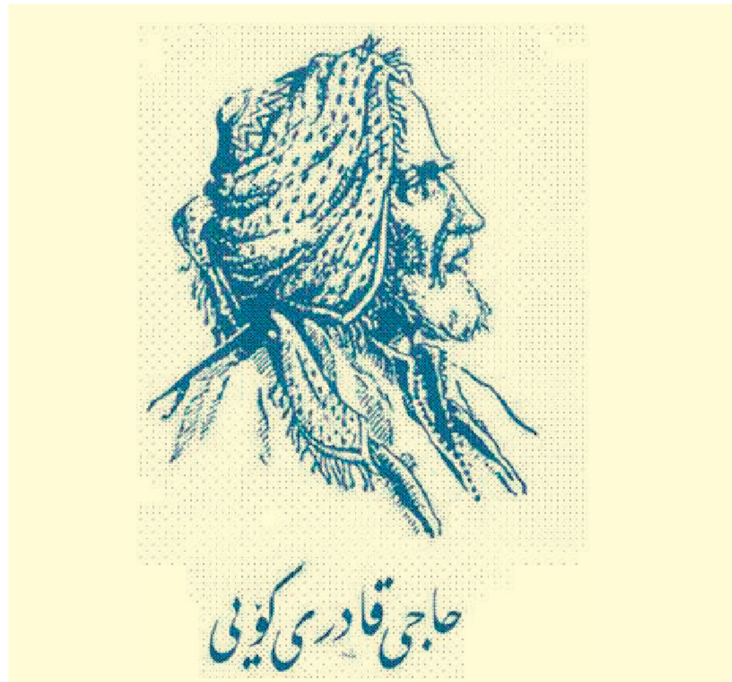
حاجى قادرى کوبى

شێخ عوبەیدوللاى نەه‌رى کورپى بنەمانە یەکی ئاینى و تەریقه‌تى و پیاویکی مەزن و ناودارو خۆشەویستى ناو کۆمەلێ کوردە، ئەم سەرکردە مەزن و خاوهن ئەزموونە، سەرکردەى شۆرشیکى گەورەى هەردوو بەشەکەى کوردستان بووه، کە ئەو زەمانە بەکوردستانی عوسمانى و قاجارى ناوبراوه. شێخ عوبەیدوللا لەو دەور و زەمانەدا زۆر زێرەکانە مامەلە‌ی لەگەل دۆخەکەدا کردوو و هەولێ داوه خۆى لەتەلە و فیتل و فەرەجى عوسمانلى بپاریزێ، ئەو زەمانە روسەکان لەبەرانبەر هاوکارىکردنى ئەرمەنییه‌کان ویستیان لەسەر خاکی کوردستان دەوڵەتیک بۆ ئەرمەنەکان دروست بکەن، ئەمەش گەلێک رۆشنبیر و شۆرشگێرى کوردی تۆرە کرد، نموونە‌ی ئەوانەش شاعیری گەورەى کورد حاجى قادری کۆبى بوو بەغەزەلە بەناوبانگەکەى خاکی جەزیرە و بۆتان بەرپەرچی ئەو سیاسەتە‌ی داووته‌وه کە ویستویانە لەسەر خاکی کوردستان دەوڵەتى ئەرمەنى دروست بکەن. بەلام شێخ عوبەیدوللاى نەه‌رى زێرەکانە خۆى و گەلەکەشى لەو تەلە‌یە دەرپازکردوووه. چون ئەو هەستی بەوه کردبوو ئەوه تەلە‌کە و فیتل عوسمانلى و وڵاتانى ئەوروپایى تێدا یە، ئەگەر کورد بچیتە ئەو شەرپه‌وه و لەگەل گەلێ ئەرمەندا شەرپ دروست بکەیت، قازانجى ئەبۆ کورد و ئەبۆ ئەرمەن دەبێ و تەنها سوودەکەى بۆ ئیمپراتۆرییه‌تى عوسمانلى دەبێ، بۆیه شێخ عوبەیدوللا خۆى لەو فیتلە دەپاریزێ و شۆرشەکەى بەره‌و کوردستانی بن دەستی قاجارى دەبات و عەرشى دەوڵەتى گەورەى قاجارى دەلەرزینێ، شێخى نەه‌رى پیاویکی سیاسى و خاوهن ئەزموون بووه زانیویتی ئەو دەوڵەتە‌ی ئەرمەن لەسەر خاکی کوردان سەرنەگرت بۆیه خۆى لەشەرى ئەرمەنى بەدوور گرت، بەمەش هەم گروەکەى بردەوه و هەم سۆز و خۆشەویستى ئەرمەنى بۆ خۆى و بۆ شۆرشى کورد پەیدا کرد.