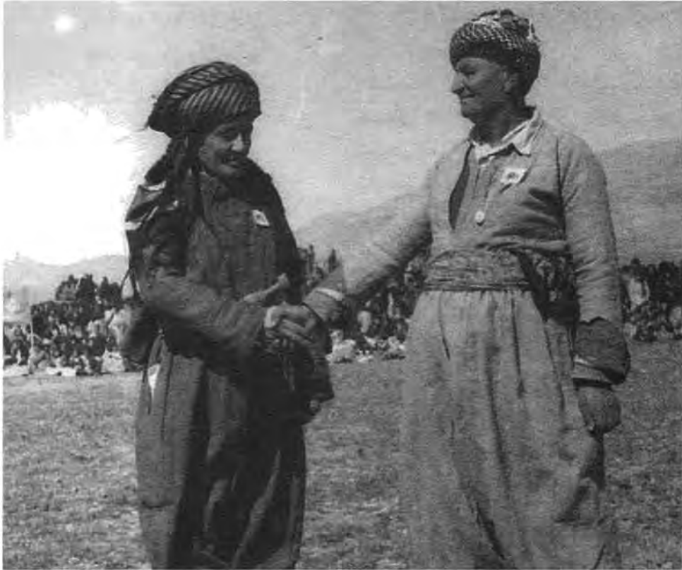
بەنگینە و نەجمە دینی مەلا

وای بۆلۆبوونەوێ ئەم شیعەرە. ئەنجومەنی شاوهرانی سلیمانی پەسەندیکرد و شەقامەکانی بەوجۆرە بەنگینە پیشنیازی کردبوو. ناونا.