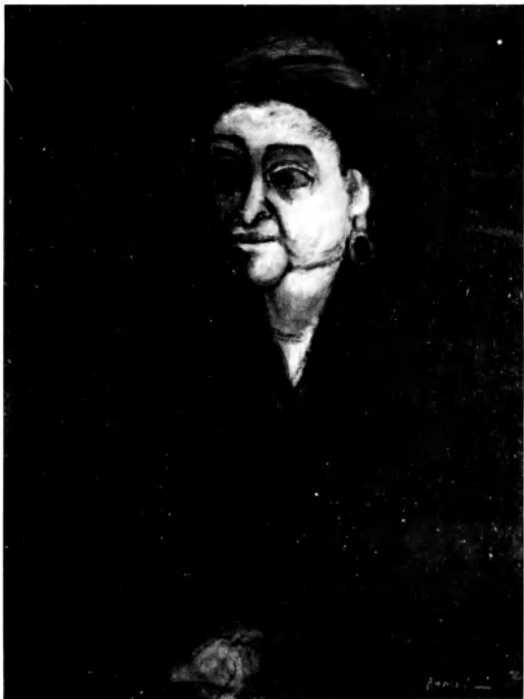
La Dame du Select 1959