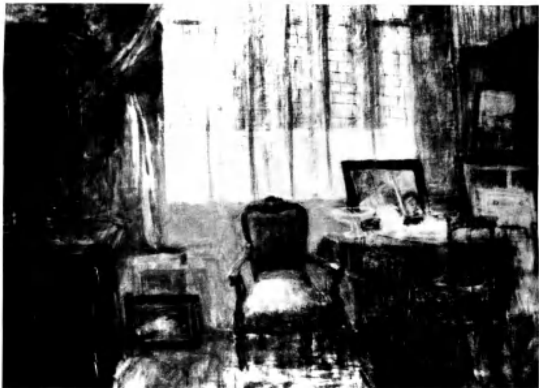
Ma Prison (No 2) (1984 - 1986)