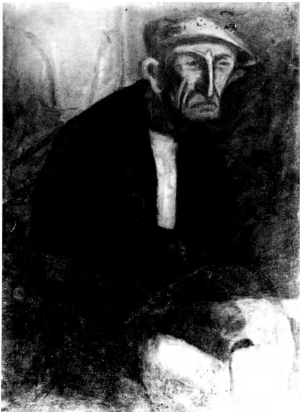
L'homme du midi (100 X 73 cm) Remzi