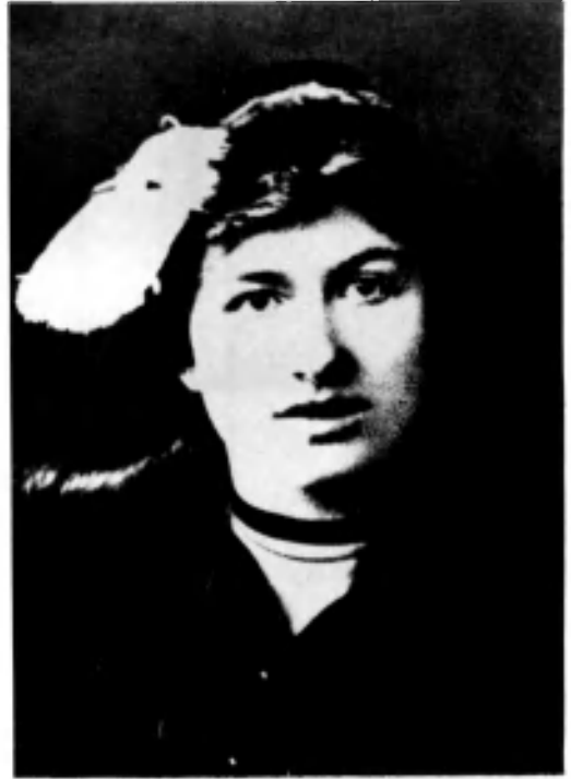
Edith Södergran (1892 - 1923)

1916 di pirtûkê xu yê "Dikter" (Hondiraway) çap keno. No pirtûkê ci di çen hondirawayê ci yê, meşhûr (weşî) est bîyo. O hondirawa yê ci zî ser hez kerdênî bîyo. Edith, grupê litaretörê Swêdî (mîyanê rewşenbîrê Swêdî) bol gird bîyo û merdim şeno vaco ki