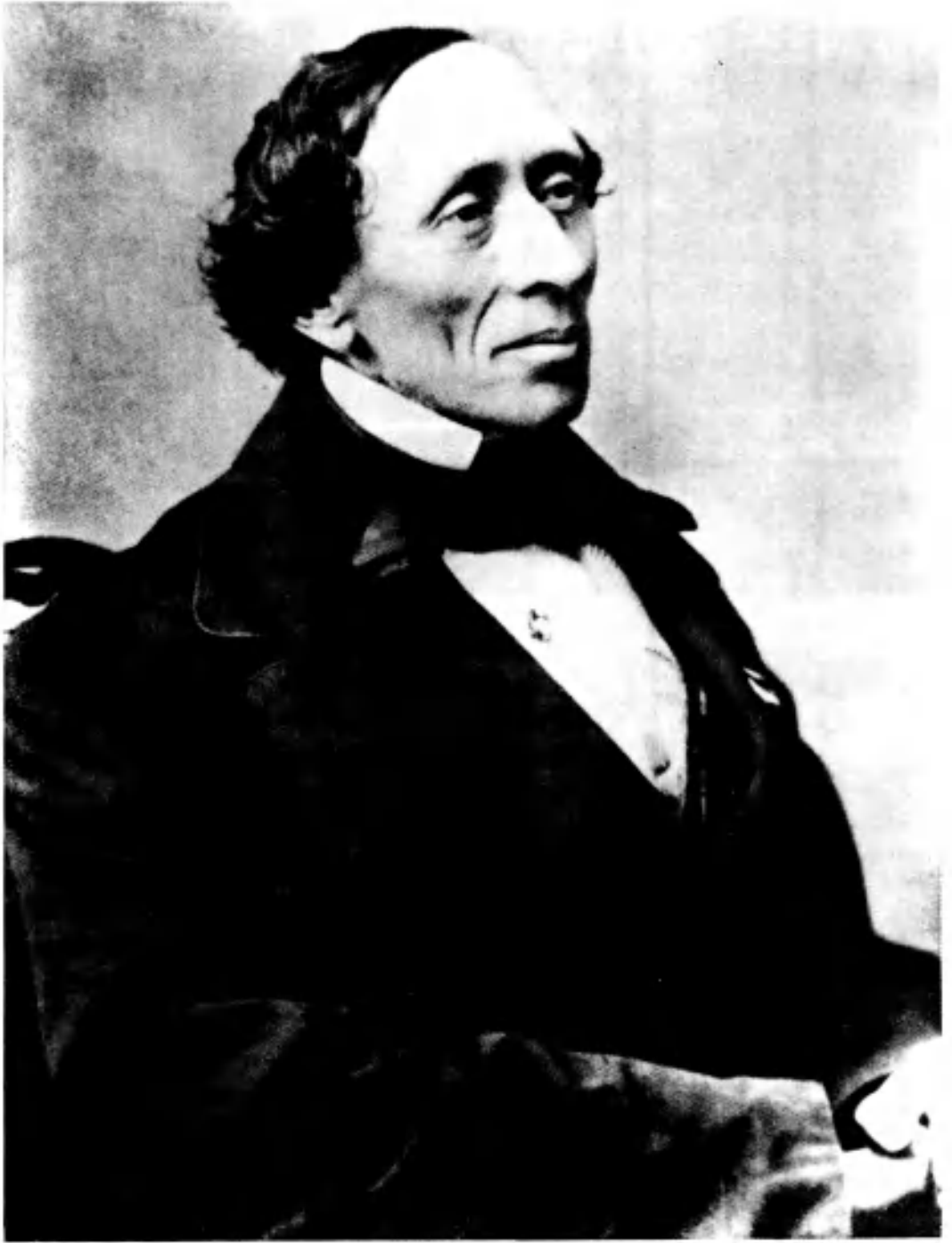
Hans Chistian Andersen 1805 - 1875