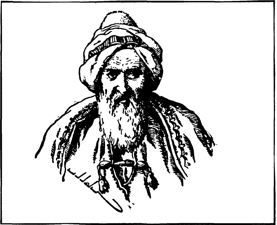
Wêneya temsîlî yê Melayê Cizîrî

"Ehmed" nivîsiye û di çend deverên din de jî wisa nivîsiye. Îcar ege navê wî çî be jî, ew di nav xelkê de bi "Mele Ehmedê Cizîrî" hatiye naskirin.