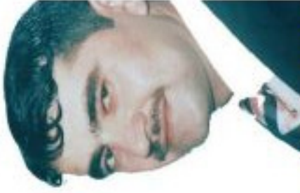
هه سی هینه تین زینانی کرتا من د سیسیسی بوزان ..... ۲۵