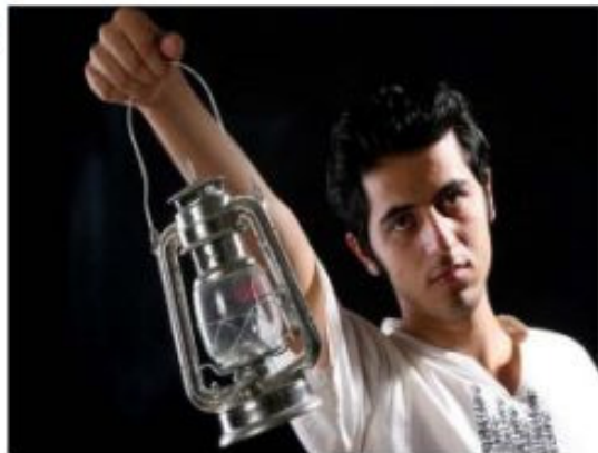
زبورت / تازه نومبر، دهلند