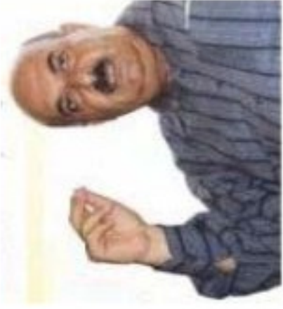
دسته لاتا مه دهسته لاتا کا پولیسی به ..... ۱۰