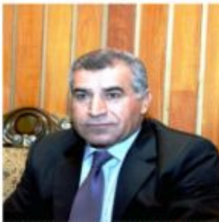
بناسفی، له اندام په رله مان

گه لکک جازان لهم وهک بهر له ماترین سهر ب فراکسیوتین ئوبوزسیوتن له مه هه ون ویزا کرینه بو هلنی داهاتی سامانین سروشتی نیاریت بهئی جهن داخیه دهسه لاتی کوردی ونایهت هه روهو پارین دست هه لات ریکن ل مه دگرن وناهیان له ده بیهته ب هیته ناشگرا کرن.