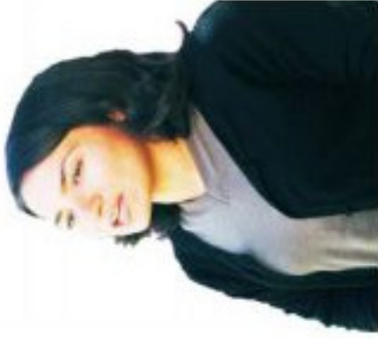
که تان چار کلتوری کوردان شه براند ..... ۱۵

زکخراوین دهه را بارزان دانه تکیا خو ده ره بران ..... ۳۰