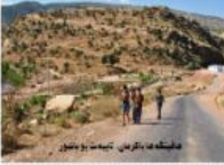
هاڦينگه‌ها باكرمان تايه‌ت بو باشور

ديدار رهمعزان، رښه‌بيري گه‌شت وگوزاري ل هه‌زا ناكري "شه‌ه هاڦينگه‌ه نه‌س فرمي په و هنده‌ك كه‌سان بوځ كهر ژي فه‌دايوون ونه و كهر ژي دوه‌ري بوون و كه‌س بفرم داخازنامه ژ تايه‌ه‌تايه‌ت نكريمه كو نه‌زي مه تسيگه‌ه‌سنيټ و نه‌زي ديه‌داچوون و هاريكاري بو بكه‌ين و هاڦينگه‌ه ريك و بزاركه‌ين"