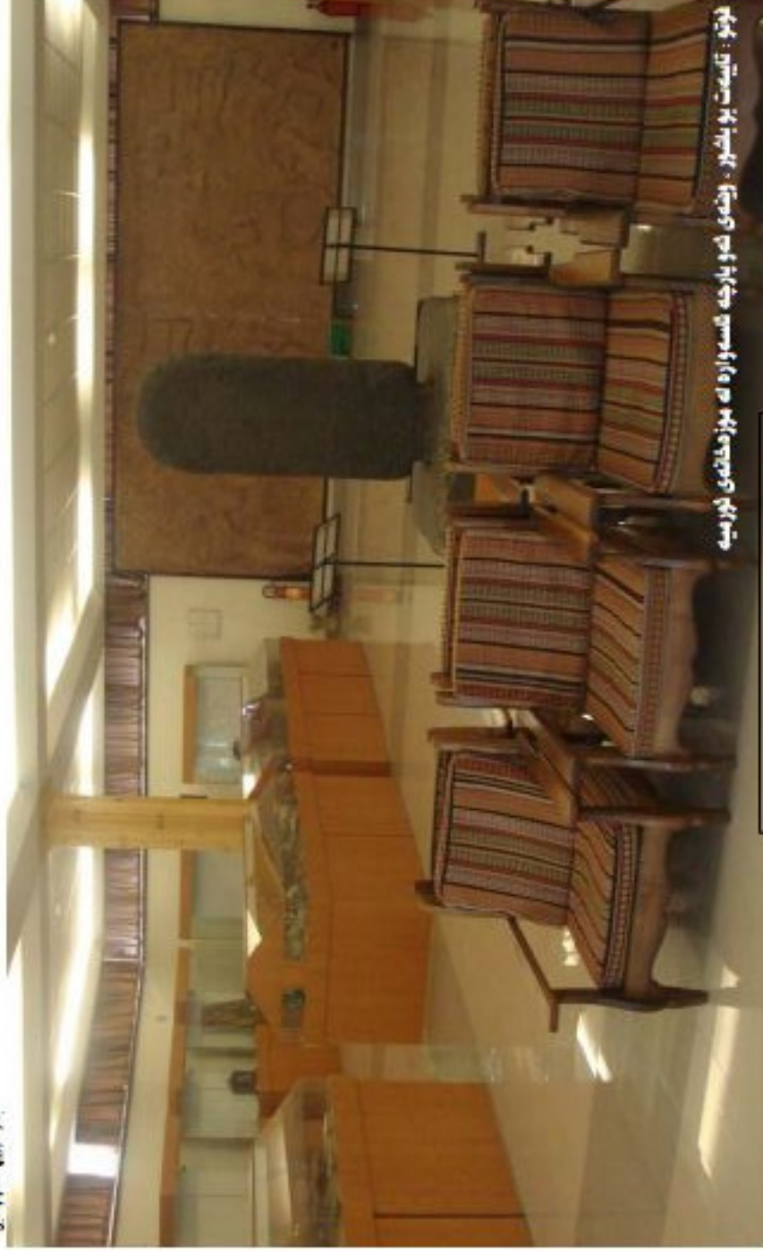
لەبى: تايەت بو باشۆر . ئىشى ئەو پارچە ئاسەوارە لە مۇزەخانەى لۇربە

راگەيانەووه كە ئەووه بىشۆر لە سنورى ئىمە بووه و ئىران بۇخۆى برەوبەتى قارىدە سۆر ئەوموشى راگەيانەد كە ئىمە لەمەوللا زياتر كارى لەسەر دىگەين وەهولئى جەدى بۇ دەدەين."