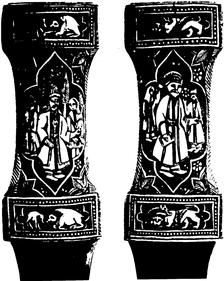
MANCHES DE POIGNARDS KURDES EN IVOIRE SCULPTÉ.

گزارشکی کولتوری گشتیبه - ژماره دوو - هارنی ۱۹۹۱