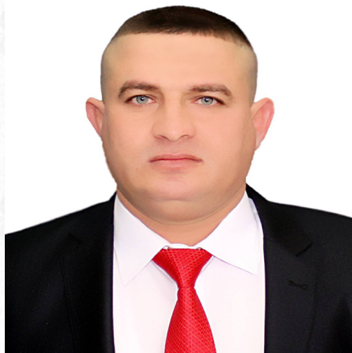
ئومید خهتاب وه هاب

له كاتی ئه م قوناغهي ئه نغالدا، دانیشتوانی چه مچه مالآ له (١١/نيسان/ ١٩٨٨) دا، خو پيشاندا نيان ئه نجامداو به گز هيزه كانی رژيما چونه وه، ژماره يه كی زوری خه لكیان له چنگی هيزه كانی رژيم رزگار كرد. ئه م خو پيشاندا نه چه ندين هوكاری هه بوو، له وانه : ١. ئو توندوتیزيه ی پياوانی حكومه تی عیراقی پياده يان ده كرد، نه ك ته نها له گه ل دانیشتوانی چه مچه مالآ به لكو له گه ل ئو كوردانه شی كاریان له گه ل ده كردن، به تاييه تی