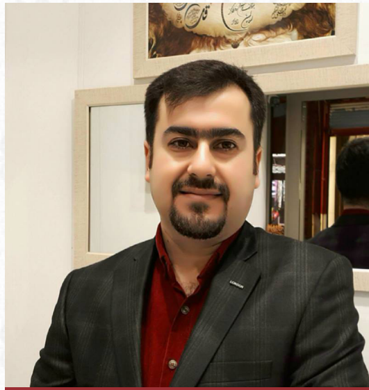
هەژار ھۆشیار بەرزنجی

جینۆساید دەستەواژەیەکی یۆنانییە بە مانای کوشتنی نەو یان تیرە دیت. ئەم وشەییەش بۆ چەند تاوانیکی دیار لە میژودا بەکاردهێنریت، وەکو: جینۆسایدی ئەرمەنەکان لە ساڵی ۱۹۱۵، جینۆسایدی جولەکە «ھۆلۆکۆست» لە ساڵی