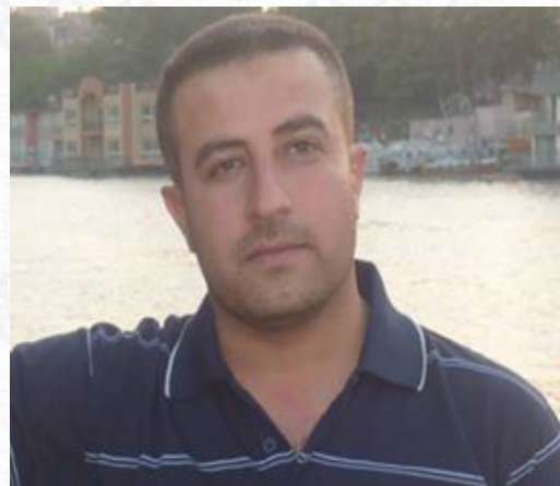
پشتیوان ئەکبەر هەفتاچەشمەیی

رێگایەکی ویستویانە ناسنامەیی نەتەووی کورد بێسپرنەو. هەلبەتە ئەو کردارەشیان بە بەرنامە و پرۆگرامی تایبەت بوو، ستراتیژو تاکتیکی گونجاو لەبارەشیان بۆ داڕشتووە بە چەند شیوازیکی ئەنجامدراوە وەک: راکواستنی بەکۆمەڵی کوردان لەسەر زیدی بابو باپیرانیان و پراکتیزەکردنی سیاسەتی بە عەرەبکردنی ناوچەکانیان، کوشتن و لەسێداردان و رەمیکردنی پۆلەکانی گەلی کورد، لوتکە و ترۆپیکی هەموو ئەو تاوانانە خۆی لە ساڵەکانی (۱۹۸۷) و (۱۹۸۸) بێنێووە لە کیمیابارانکردن و ئەنفال و وێرانکردن و تالانکردنی گوند و دێهات و ناوچە کوردستانییەکان و جینۆسایدی دانیشوانەکەیی.