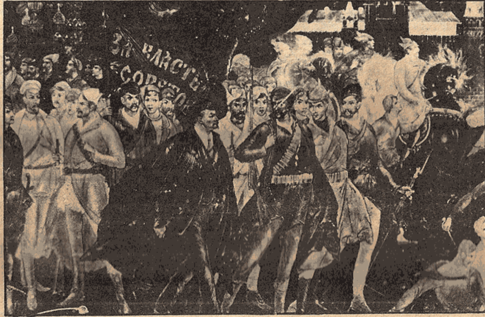
Lenin, Lı Meydana Sor millet ra xebêrde.