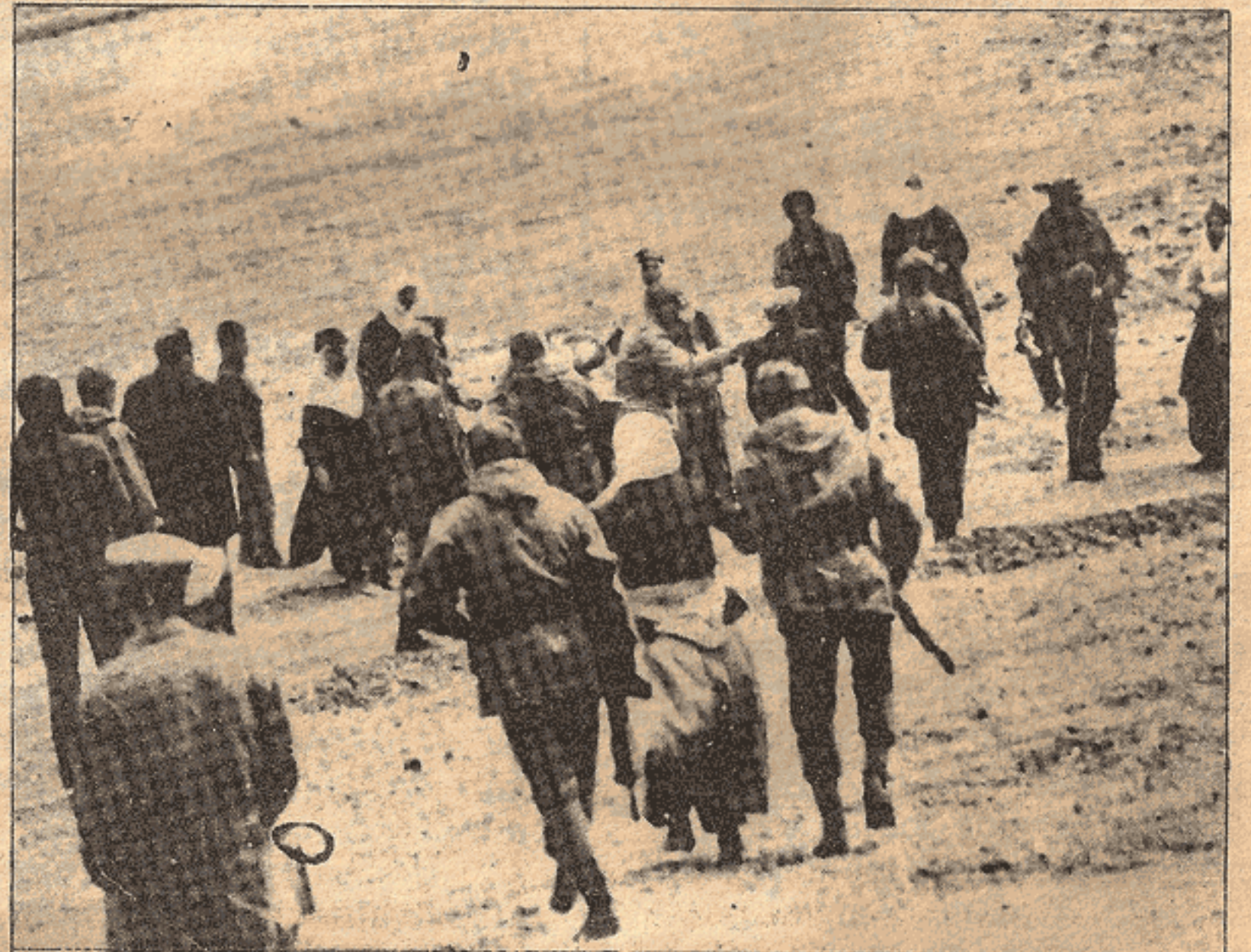
Bu fotoğraf bir savaş alanını göstermiyor. Bu, Kürdistan'da hergün rastlanan olaylardan biridir.

İşte bu örnekler, sözkonusu 20-25 dakikalık, süratın, "havadan ve karadan" müdahalenin ne işe yaradığını açıkça gösteriyor. Ve bunlar, bu