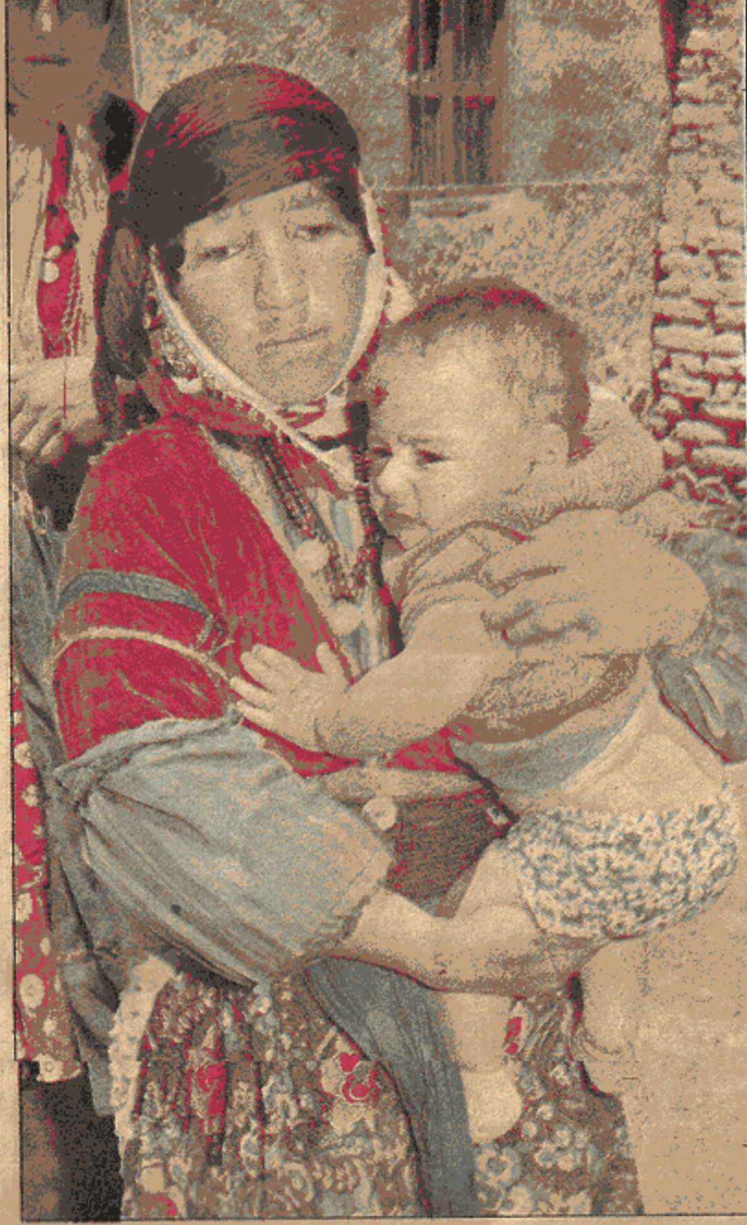
Eğitimsizlik Kürdistan'lı çocukların geleceği olmayacak....

MC döneminde alelacele çıkarılan ders kitaplarında bu şovenizm ve ırkçılık daha da hızlandırılmıştır. Bozkurt resimleri kitapları süslemekte, ergenekon masalları daha da fütursuzca, genç beyinlere bir gerçek gibi sunulmaktadır. Millî Eğitim Bakanlığınca çıkarılan, desteklenen pek çok yayında, örneğin çocuklar için çıkarılan "Yavru Kurt" dergisinde, insanlarımız, daha çocuk yaşta ırkçı motiflerle, şovenizmle, başka halklara karşı saldırgan duygularla şartlandırılmaktadır. Bütün bunlardan amaç gençliği ve insanlarımızı toplumsal sorunlardan ülke gerçeklerinden uzaklaştırmak; onları, emekçi