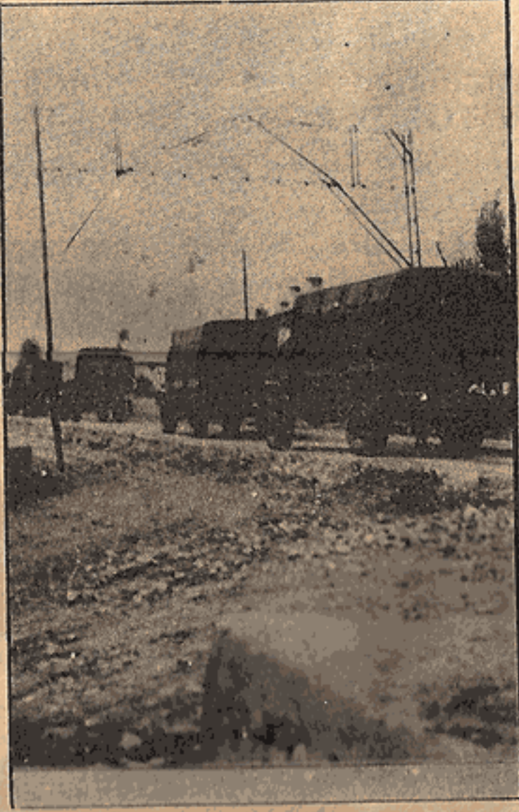
"Operasyon'a gidiliyor. Arkadaki araba boş, ama diğerlerinin perdesi çekili, içleri komando dolu..."

Türkiye de faşist bir dikta kurmak isteyen Tekelci Burjuvazinin iktidarı 2. MC, Kürt ve Türk işçileri üzerinde sömürü mekanizmasını son haddine vardırıarak, işletmektedir. Bunun en güzel örneği, kazamız ergani'de Aksa İnşaat Kollektif