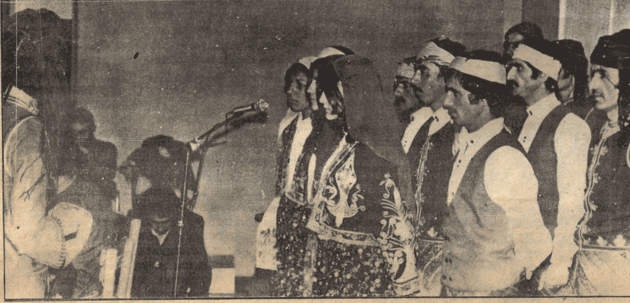
DHKD'nin korusu, Devrimci marşlar ve türkülerle geceye renk kattı.

rimci, demokrat bir doğrultu kazanmasını engelliyor. Diğer yandan umut verici gelişmeler de var. Kitlelerden kopuk, kendi başına, sertüvenci, bireysel teröre yönelik eyilimlerin başarı şansı olmadığı deneylerle de