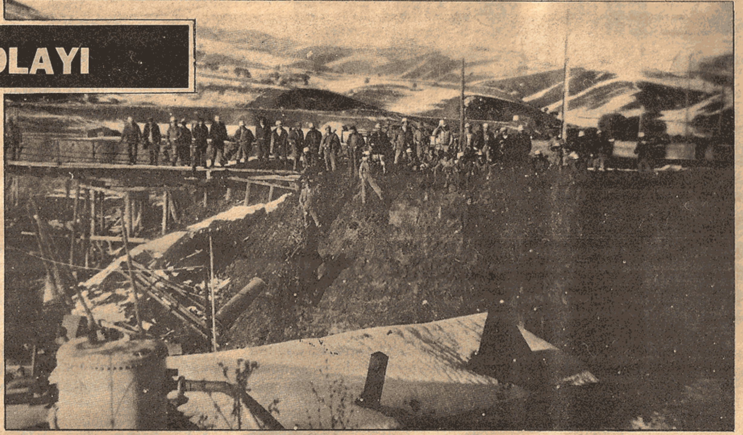
Aşkale'de Maden işçileri; tüm oyunlara karşı direnişleri başarıyla sürüyor...