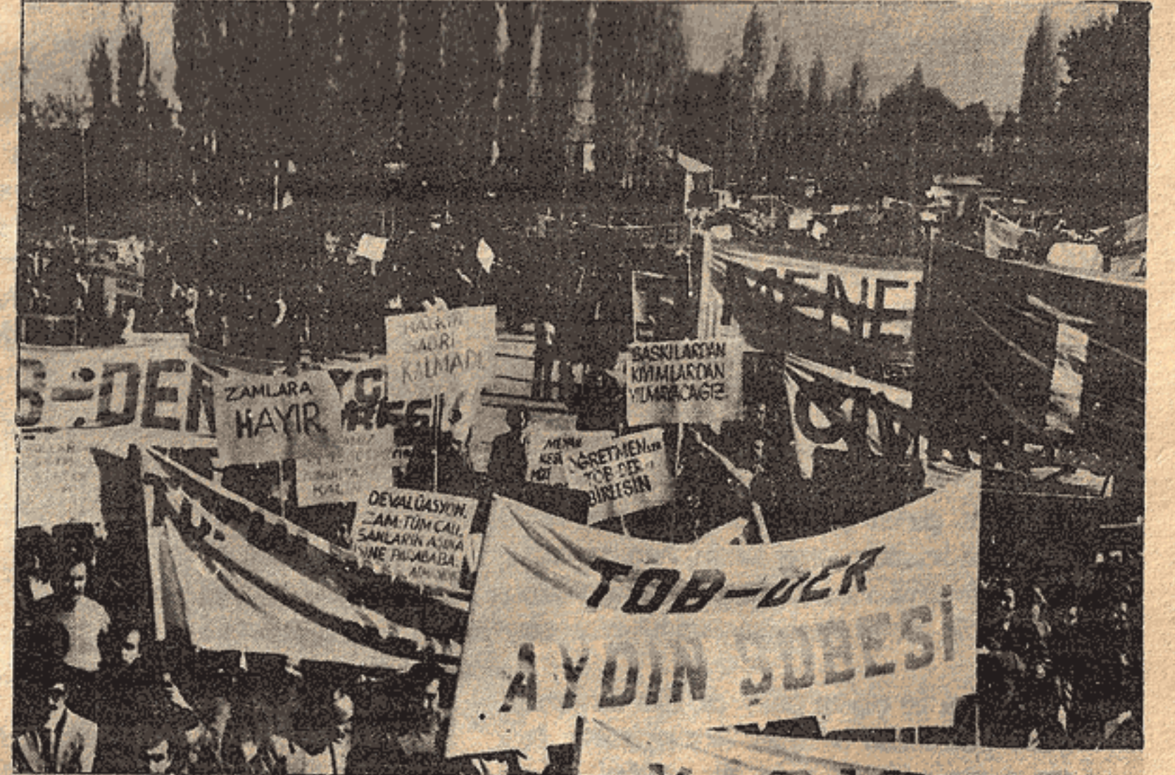
Kiteler Denizli'de hayat pahalılığını, taban fiyatlarını ve faşist baskıları protesto ettiler...