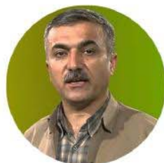
ن. ديار غەرىب

ئەو كىشەۋ قەيرانانەي ئەمرو لە باشورى كوردستاندا ھەن و قول دەبنەۋە، بە تىروانىنى دەسلەت تەنيا ھۆكار دابەزىنى نرخی نەوتەۋ ھىزە دەسلەتدارەكان پىيان وايە دەسلەت لە باشورى كوردستاندا ھىچ كەمورىيەكى نەبوۋەۋ نى، بەلكو ھۆكارى سەرچەم قەيرانەكان دابەزىنى نرخی نەوتە، ئەم چەمك و تىگەيە پارتى دىموكرات لە ھەموو لاىەنەكان زياتر داکۆكى لىدەكات و پىي وايە ئەو سىياسەتەي لە بواى ئابوورى، پەيوەندى دەرەكى و بەرپوۋەبردنى ناخۇدا پەپرەۋى لى كرددوۋە سىياسەتەيكى سەرکەتو نەبوۋە، بەلام بەختى باش نەبوۋەۋ دابەزىنى نرخی