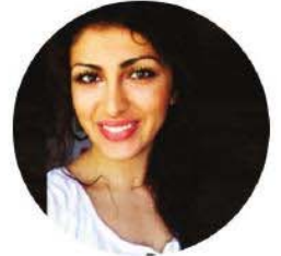
ن. دلار درك