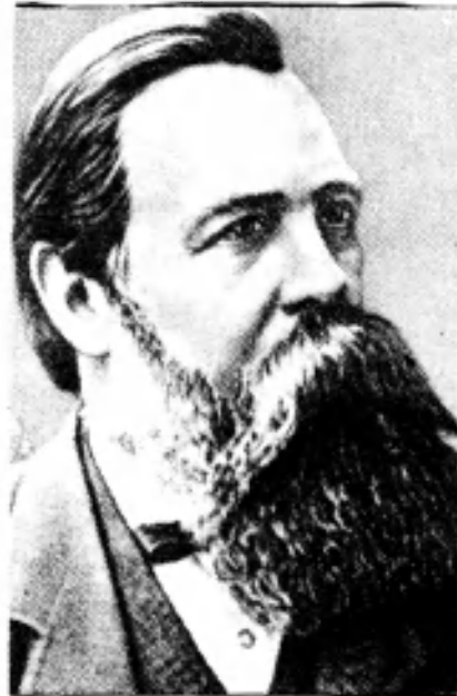
F. ENGELS (1820-1895)

Bûrjûwazî gunda kirbin bindestîva bajêr. Wê bajêrên qirase ava kir; wê bi awakî harîkayî gelhayê (nifûsê) bajaran li gora yê gundan zêde kir û wilo kêrîyek girîngê (mihîmê) xelkê ji kilekorî û gêjîva jîyana zevîvan qetand. Çawa wê gund kirbin destê bajêr, wê wisa jî welatên hov û nîv-hov kir girêdayîyên welatên nêşvecûvî