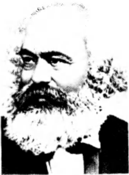
KARL MARX (1818-1883)

Wê ricifandinên pîrozên zikra dînî, kelûbîna şovalyeyî, pêgîmendahiya (hîsîtiya) bûrjûwaya biçûk di nav avên qeşayî yên hesabê xweperest de fetisand. Wê serbilindahîya (vakara) kesane rakir kir rûmeteka basîta danûstanê; di şûna azadiyên bêhejmarên gerew (garantî) kirî û çendî biha bidest xistî, wê azadiya yekta û bêdilovanîya têciriyê danî. Bi gotinekî, li dewsa kedxuriya ku rewnayên (xeyalên) dînî û siyasî xêlî dikirin, wê kedxuriya vekirî, bêşerm, yek ser û stûr danî.