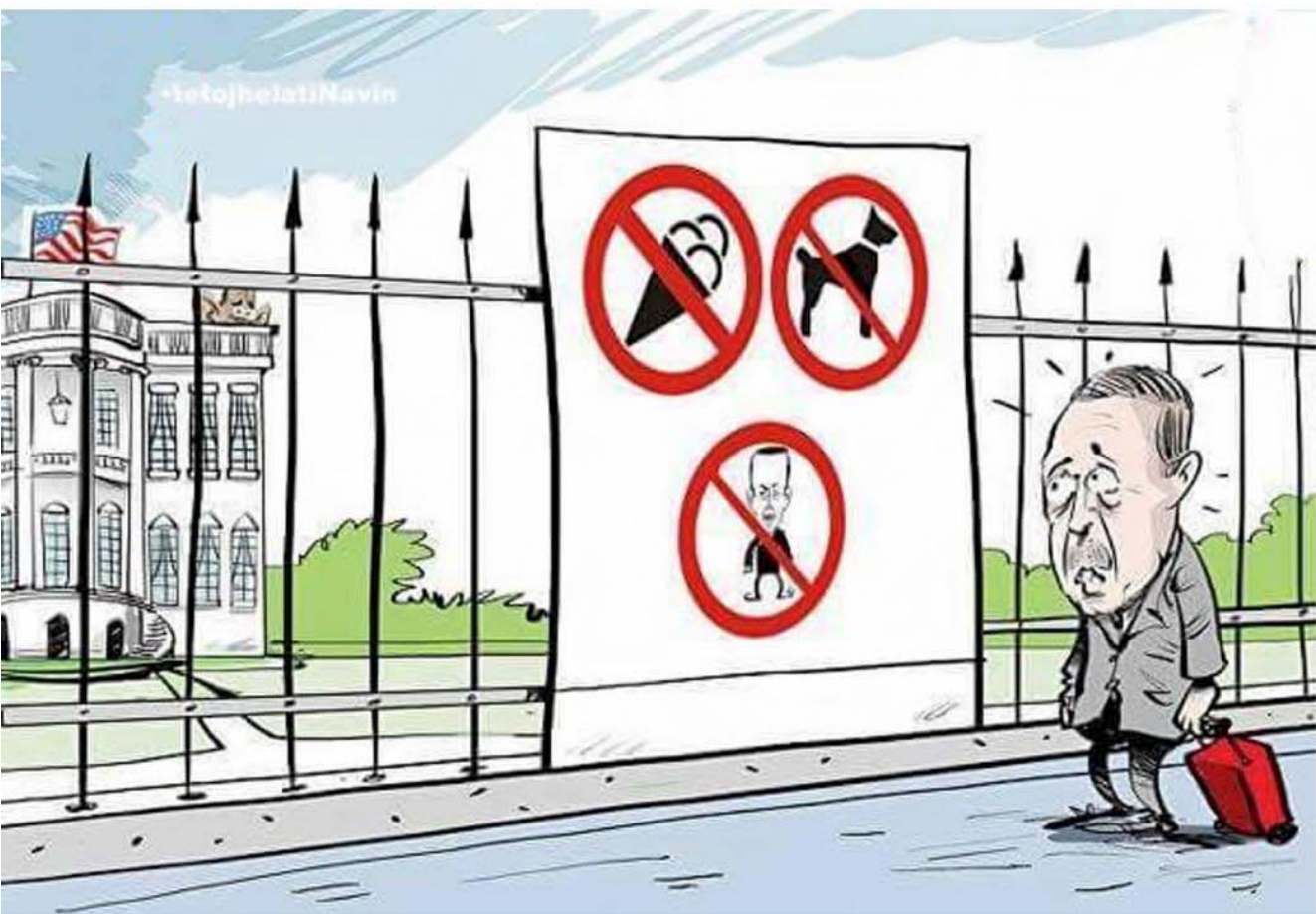
دوابىن سەردانى ئەردۇغان بۇ ئەمەرىكا!!!

ناسىۋناليزمىك كە لە دەزگاي دەولەت-نەتەوھ و ئىسلامى پوانخووزدا بە دامەزراوھ كراوھ لە ژېر چاودېرى سەرمايەدارىدا خۆرەلاتى ناوينى لەبەرەككەلەشاندووھ. بە دامەزراوھ بېكردنى شىۋازىكى نويى بېكردنەوھى نامەركەزى كە دەكارىت فرەپەنگى كولتوروى لە ئامېز بگرىت و دژ بە سەرمايەدارى و دەخالەتى دەولەتە لە ژيانى كۆمەلايەتىدا وەك مۇدىلى كۇنفىدرايىزمى دىموكراسى (كە لەلايەن ئۇجالانەوھ پىشتىيازكراوھ و لە رۇزافا پەيپەي لىدەكرىت) زەرورەتتە بۇ زالبوون بە سەر ئەو ئايدىۋولۇژيا پوانخووزانەدا كە خەلاكانى خۆرەلاتى ناوينى بە ناقارى رەشەكوژى و جىنۇسايد و خنكايان لە دەرياكندا برد و دواچار كىردنى بە سۈالگەرى دەركەي و لاتانى سەرمايەدارى.