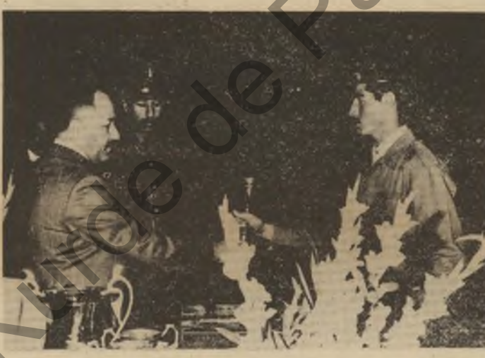
ئیواری رۆزی سن شه ممه ی زابردوو نه ندای سه رکردایه تی شۆرش وه زمانه ی سوپای میلی کاک طه الجزراوی سه ره رشتی ئاههنگی ده وروانی ( زوبات سه فی ) ده وروی البکر ی سوپای میلی کرد .

ناههنگه که له قوتابخانه ی سوپای میلی له به غدا ریکخرا بوو ، هه فالان نه ندامانی مه کته بی سه ربازی حیزبی به عسی سوپاسیستی عه رب و عه میدروکن سه رۆکی ئه رکانی سه رکردایه تی سوپای میلی و به ریز پارێزگاری به غداو به ریزان لی برساوانی سوپای میلی ناوچه ی به غداو جه ماوه ریکی زۆر له وه ئاههنگه دا به ندار بون .