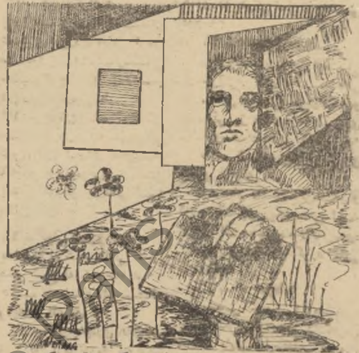
« بازام » کردیه تی به کوردی

پاول فینس له سالی ١٩٢٢ دا له شاری « کۆنیگسبرگ » له دایک بو و بن چکه له شیمر چیرۆکیش ته نویسن ، به تابه ی چیرۆکی منالان ، تانیستا جه ندان باداشتی نه ده بی و هونه ری پش به خسه راوه ناوه رۆکی زوربه ی شیمه ره کانی بانگ کردنه بۆ تیکۆشان له پشناوی کۆرانی جیهان و به ناگای مرۆف له پشناوی سۆشیالیستی دا ٠ تهه مه پارچه شیمه ری به ناوینشانی « خواست » نمونه یه که له شیمه ره کانی : باخواست و ناره زومان ٠٠ بیریکی کراوه فراوان بن ٠٠ با به وهی دوا خۆمان جزئی ته هیلین ٠٠ هاوینگی بین شه مالی خۆشه ویستی تیا هه ل پکه ٠٠ دارستانیکتی چری رازاوه بن ٠٠ کیتکه ی ده وه له مه ند ٠٠ شه قامی ریکو پیک و فراوان ٠٠ مرۆنی دل بکو ژیر ٠٠٠ شیمه ری جوان ٠٠٠ خۆشه ویستی به هه موو لایه کدا بلاو بیکانه وه ٠٠ زه رده خه نه به هه موو منانه کان به خه شین ٠٠ خۆ ته گهر ، هه ر ناخۆشه یه کیش هه بو ٠٠ با ، ته نیا قه تره یه ک بن ٠٠ به لام به ختیا ری ، با به قه ده ر فراوانی هه موو ده ریاکان بن ٠٠