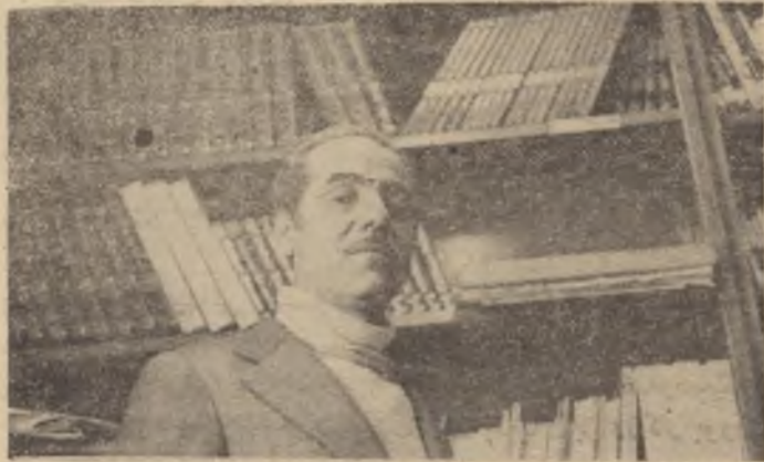
ئەگەر ئېمە توانىمان ، لەدەرسە بەنرەخەكانى سالىھى رابوردو ۋە نەدەرگىزىن ۋە سوۋەبىيىن بىن گومان ئەمە ھىنانە دى