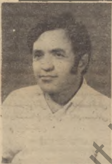
ھەملىھى ھەلا كرىم