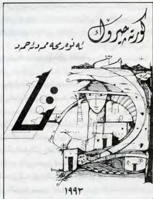
● کورتە چیرۆک، نووسەر: نه‌نوه مه‌مه‌د نه‌مه‌د