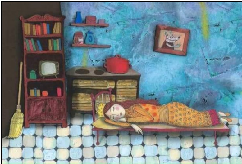
Poem by: Dilawar Karadaghi Translated by: Choman Hardi

4 years ago today, the Ezidi genocide! We will never forget