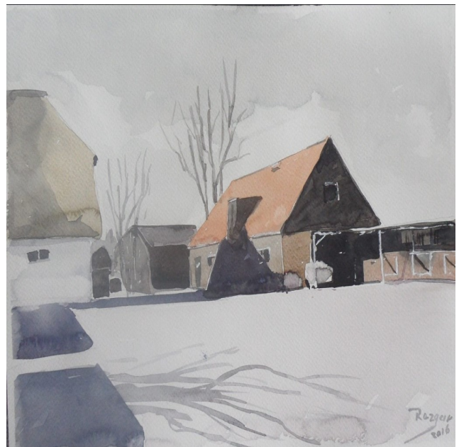
خانوى جوتيارىك لە ھۆلەندا boerderij aquarel 25 x 30 cm