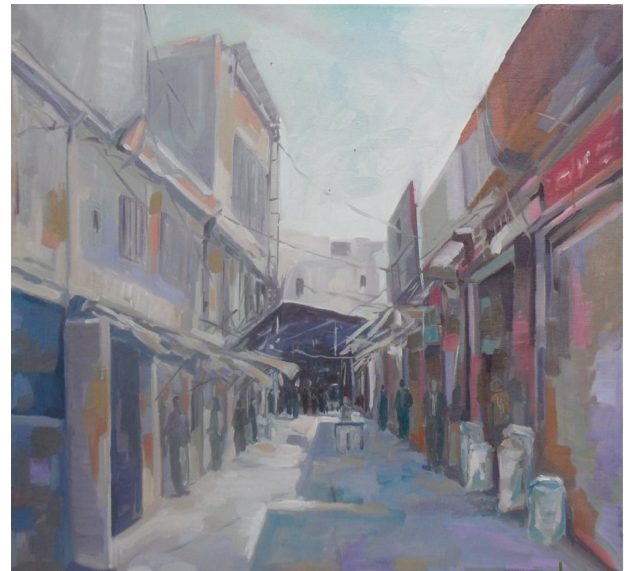
يەكك لەبازارەكانى سلېمانى — سەعید تاكۆيى —