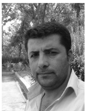
جه بار نه حمده

نه وه یشى که کراوه هیچ نیه له چاو نه و کاره ساته گه وره یه دا و ده بو نیسته هه له بجه گه وره ترین سه نته رى بازگانی کوردستان و عیراق بوایه به ده یان و سهدان پیستورانت و ئوتیلی (خمس نجوم) یان پینج نه ستیره ی، تیدا بوایه، و سالانه یادى نه و کاره ساته به مودیرترین شیواز بکرایه ته وه به پئ بکرایه وه به رکه وتوانی نه و چه که قه دهغه کراوه برانایه بوئو وروپا و چاره سر، نه و قوربانیا نه ته نها له پوی جهسته ییه وه زامار نه بون بگره خه لکی نه و شاره شه هیده له پوی دهرنیشه وه زیانین به رکه وتوه و بونه ته قوربانى نیمه ده بینین سالانه که یادى نه و کاره ساته گه وره یه ده کرت وه، لپرسراوه کانی نه م هریتمه به ئوتومبیلی نه خیر مودیل جاده کانی شاره شه هیده که ده پتون و له سر مه زاری شه هیدان به بى هیچ شه رمکردنیک به لئینی باق و بریق به و