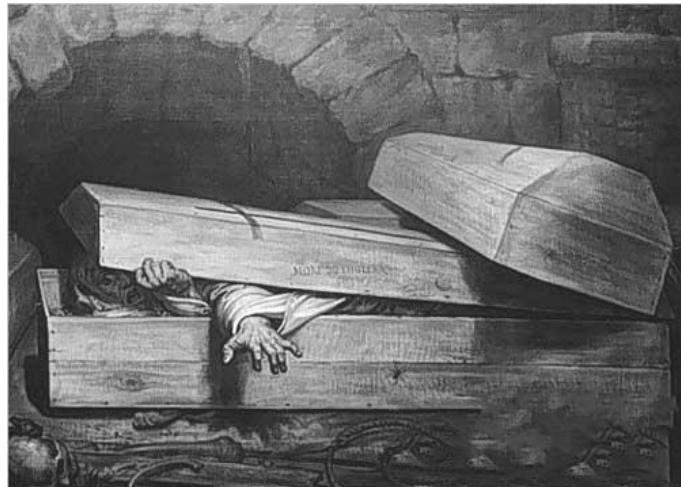
شینق ئه حمه د غه فور