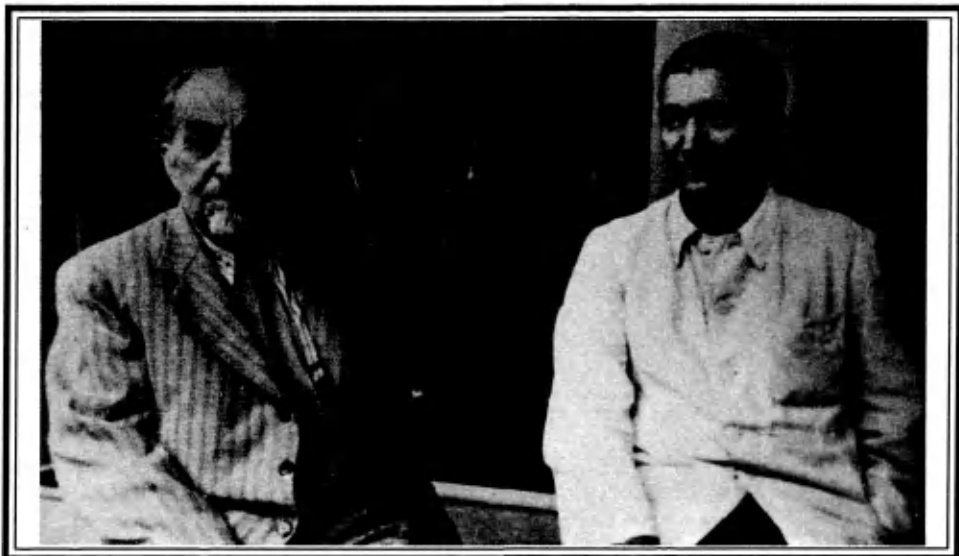
Heciyê Cindî û nivîskarê ermenî Avêtik Îsahakyan di sala 1958 de.

Heciyê Cindî ji wan nivîskarê me bû, ku bi navê wana edebiyeta Kurdên sovyetî dest pê dibe. Ji salên 30 î dest pê kirî gelek kitêbên wî yên şêran,