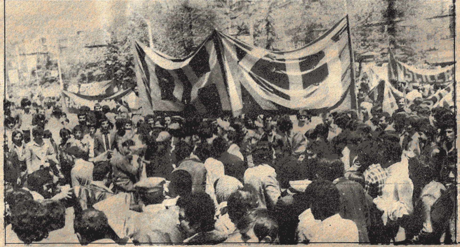
KÜRT GENÇLİĞİ, EMEKÇİLERİ YİĞİNSAL OLARAK 1 MAYIS TÖRENLERİNE KATILDILAR...

Burjuva basını bu bakımdan tam bir curcuna ve rezillik içinde: Kızıl bayraklar taşınmış; Marks'ın, Engels'in, Lenin'in resimleri taşınmış "TKP'ye Özgürlük", denmiş, "İşçilerin birliği, halkların kardeşliği", "Kahrolsun sömürgecilik", "Halklara özgürlük"