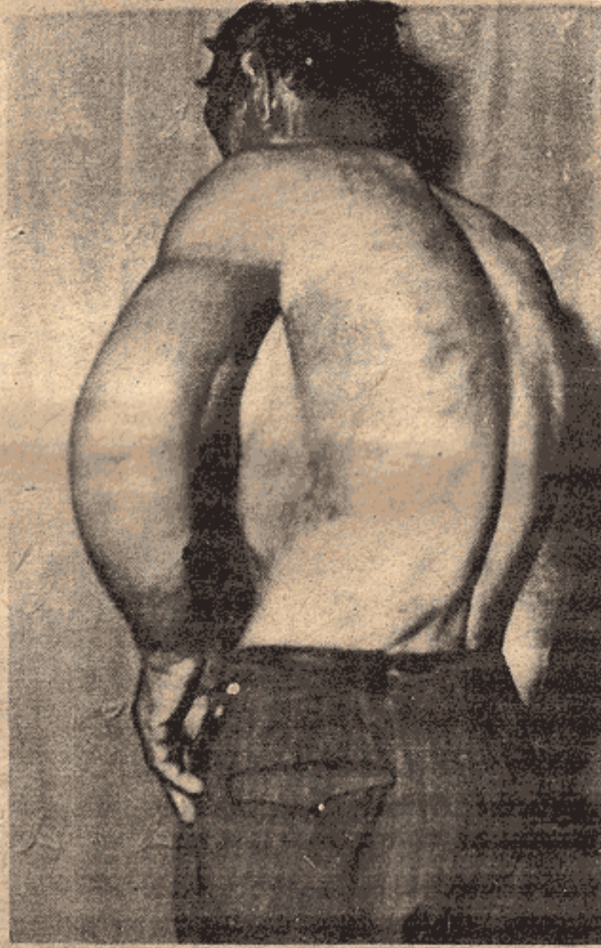
SAIT TAŞDEMİR -

Kimlerin insanlık suçu işlediği ve kimlerin bölücü olduğu bir kez daha görülüyor mu?..