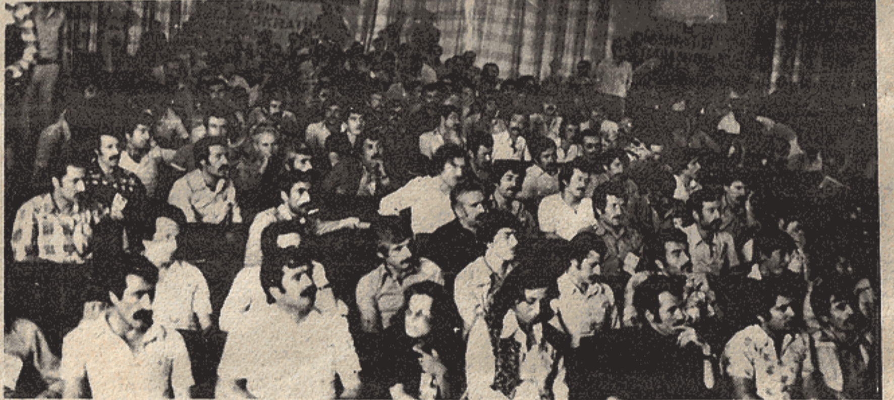
TÖB-DER Genel Kurulundan bir görünüş...

Bazı lyl niyetli kimseler, "divanın düşürülmesine ne lüzum vardı?" diye düşünüyorlar. Lüzum vardı, çünkü ibradan sonra bay Üstün, kongreyi keskin keskin tatil edecekti.