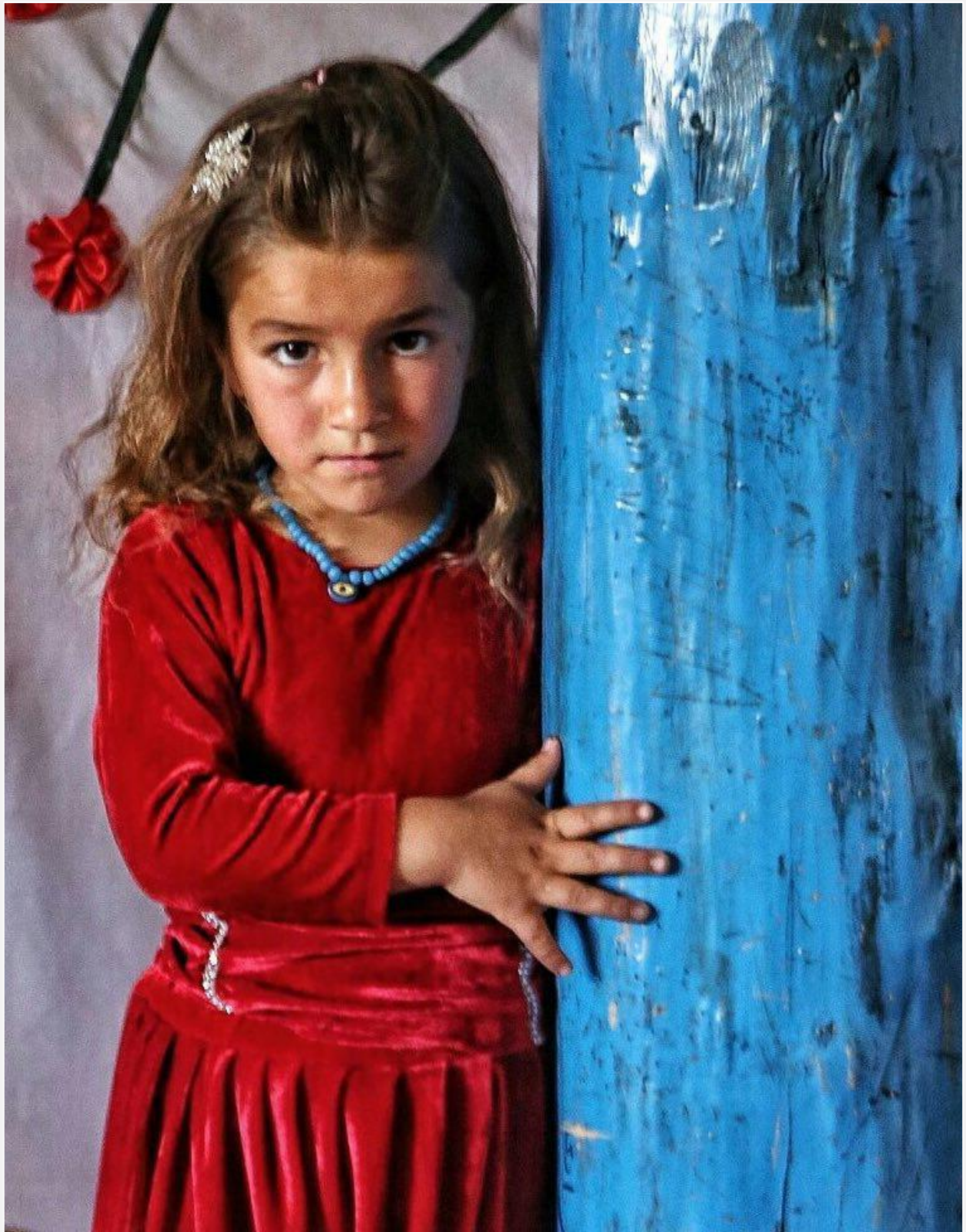
📷 عهلى رهزهويان