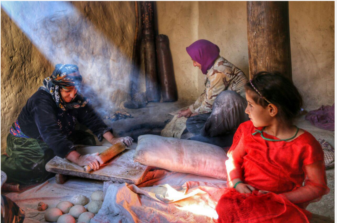
📷 عهلى روزهويان