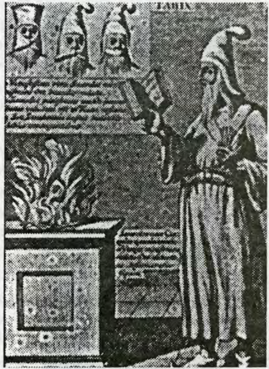
مدغ و ناگردانیک له گتیبی «سه‌فرنامه‌ی جدکسون» وهرگیراوه

– چند نمونه بۆ باو بوونی چند ژنی: کوروش سۆ ژنی ماره‌کراوی هه‌بووه. نیوی شه‌ش ژنی ماره‌کراوی داریوش هه‌یه. نهمه جگه له‌و ژنانه بووه که تنیا بۆ له‌گه‌ل نووسن له خه‌لوته‌یدا رایان گرتووه. بۆ وینه نهرده‌شیری سیه‌م سیه‌سه و شه‌ست ژنی له‌م چه‌شنه‌ی هه‌بووه (شه‌ویک یه‌ک ژن له سالدا). ۲۶