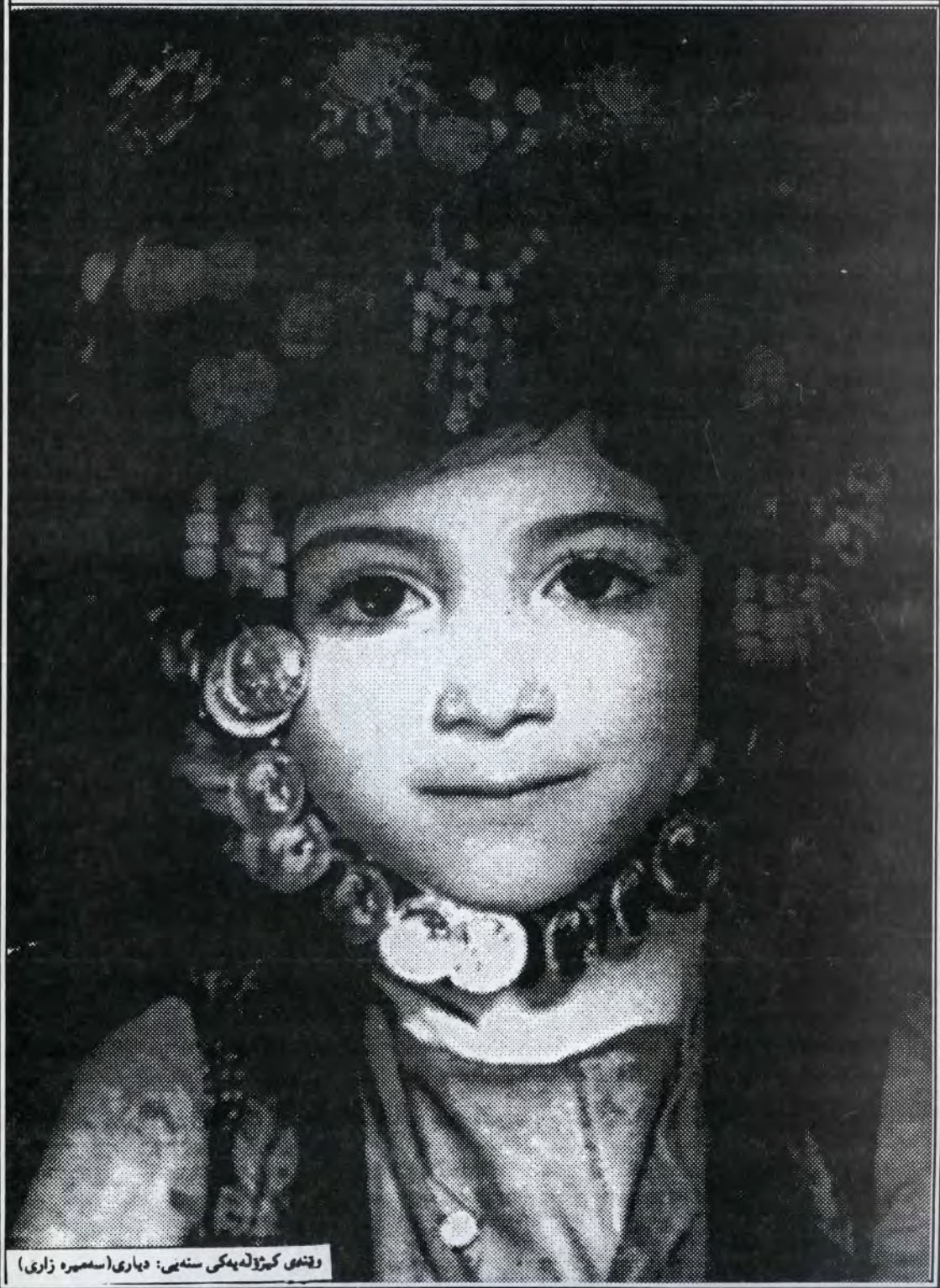
وێنەی کێژوله‌په‌کی سه‌نایی: ده‌باری (سه‌مه‌ره زاری)

Cultural - Literary Kurdish Magazine No: 10. January, 1996.