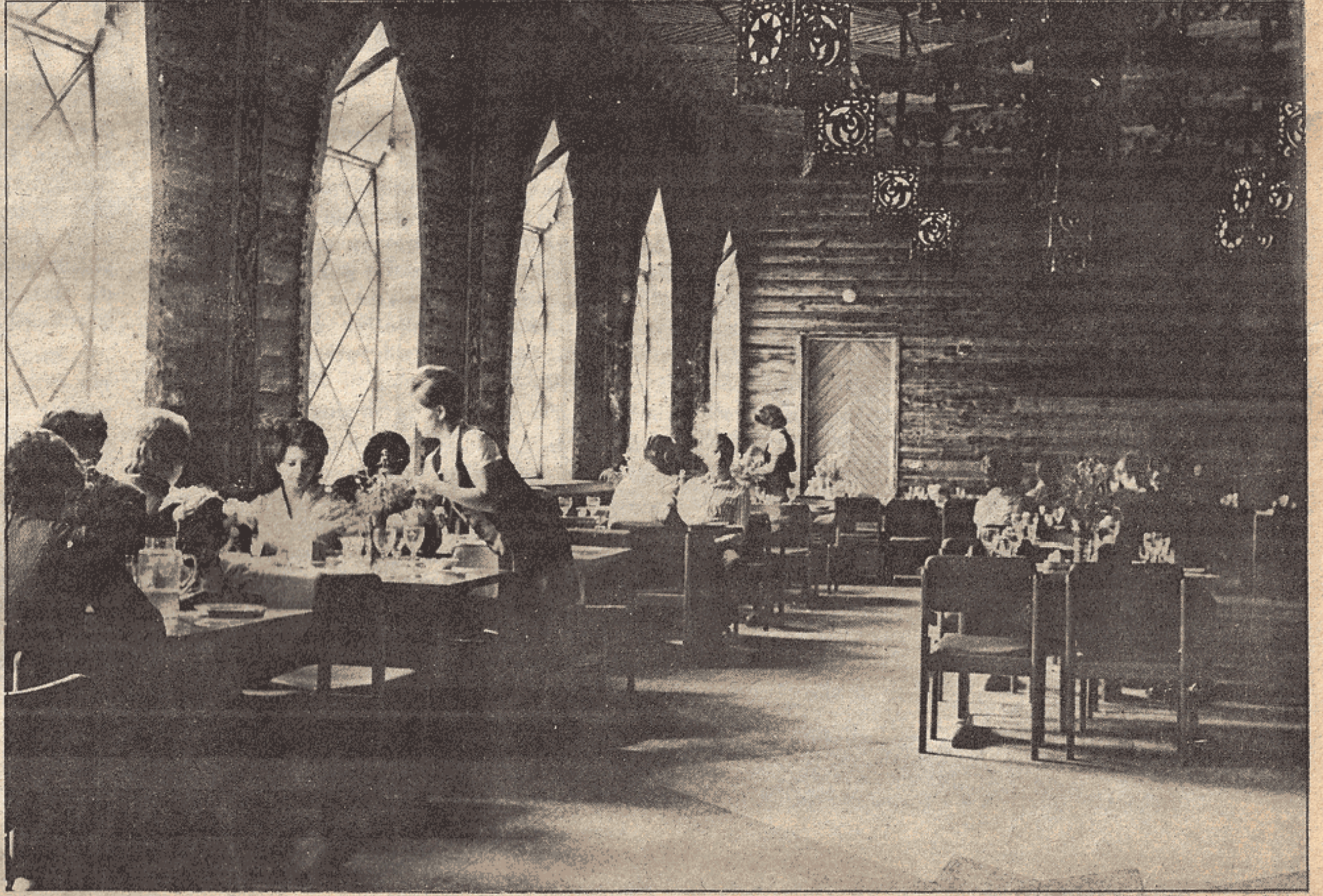
Bir köy lokantası... Sosyalizmde herşey insan için...

Sosyalizm düşmanları, sosyalist ülkelerde "kişinin devlete çalıştığını" söyleyerek saçmalar ve halkın yoksul olduğu biçiminde yalanlara başvururlar. Bir kez sosyalist ülkelerde devlet bir