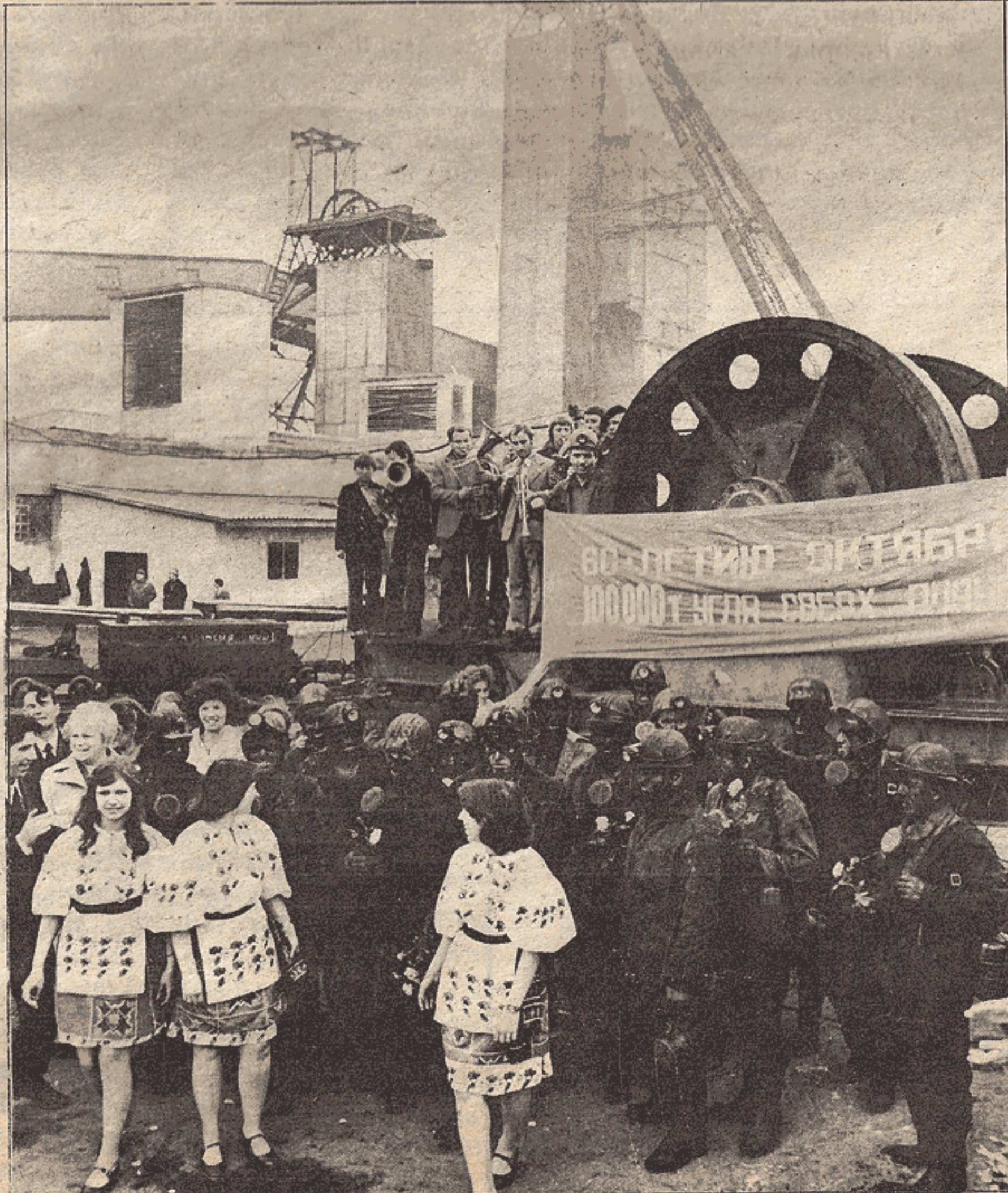
Bir kömür madeni işletmesi. Ekim Devriminin 60. yıldönümü için plânlanan 100.000 TL. üretimin üzerine ulaşmıştır...

Ekim devriminin 61. yılında Sovyetler Birliği işçi sınıfı, ileri, özgür barışçı yeni dünyanın kuruluşunda omuzuna düşen büyük görevi başarıyla sürdürüyor.