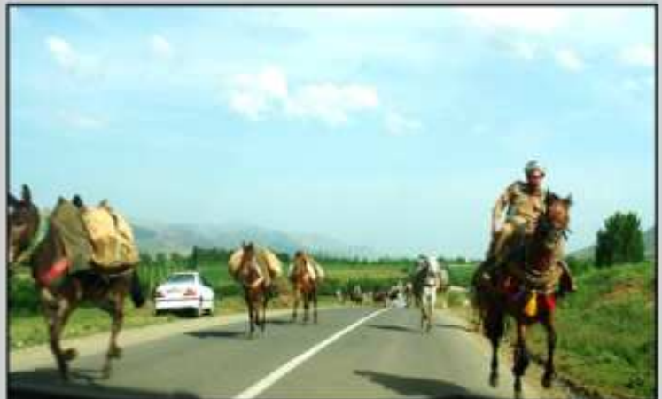
روژ هه لات: هه ريما ياساغ