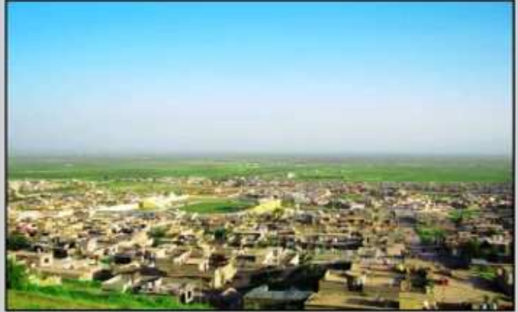
به رده رهش قه زايه كي بي ناو نيشان

گوڤارا باشور به ره هه به يو به لافكرنا هه ي ريكلامين بازارگاني