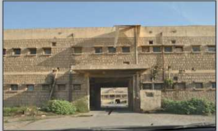
چاره نشيسي ۳۰۰ سه ره خيژانا دناشبه را نيدارا كوردى و يا موسل شه پوزه بوويه