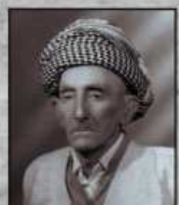
مهحمیده ناخایع زیباری