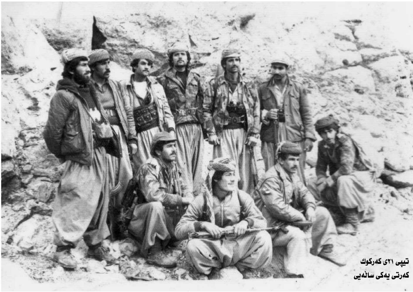
تىپى ۲۱ كەركوك كەرتى يەكە سالتەى

زۆرەون ناوچەكە يەكپارچە گرى گرتو بوو بە دوگەلپكى چرو يەكترمان باش نەدەبىنى ۋە كۆپتەردەكاش بەھۆى دوگەلەو ۋە كەوتنە پاشە كەش كەردن، لەو كاتانە ئىمە دووبارە كەوتىنە ھىرش كەردن بۆ سەر ئەو ھەيزەى دوژمن كە ھاتبوو پىشەو، لە ئەنجامى ئەو