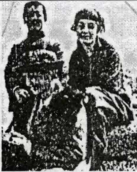
خوتندکار قازی و ژنی له گه‌ل میسیونریتیکی کۆمه‌له‌ی سویدی له سهر دیواری ۵۰ پایی کۆنستانتینۆیل

مامناوئنجیییه، و له سالۆنیک له خوتندنگه‌کانی به‌رزنی پڑشکی خوتندوویدی. باوکی له وه‌زاره‌تی خزمه‌تی گشتی (Public Department) تورکیادا کاره‌دهست بوو. دایکی خیزانم هیتشاش زیندووو و دوای مردنی میترده‌که‌ی شووی کردووته‌وه. هاوسهرم زۆر خوتنده‌وار و به کولتوره و فره‌انسه‌ییه‌کی زۆر باش ده‌زانن. نیتمه زۆرجار به‌یه‌که‌وه نینجیل به تورکی ده‌خوتنینه‌وه. نهن زمانێ کوردی فیتر ده‌که‌م و نیتستا هیندیک کوردی حالی ده‌هین. هیوادارم له داهاتووداهاوکاریتیکی به‌ نرخێ من بێن بۆ په‌روه‌رده‌کردنی ژنی کورد. نهن کاته به‌ده‌رفه‌ت ده‌زانن و من هاوسهرم سلاری مه‌سیحییانه‌ی خۆمان بۆ نیتوه‌ ده‌نیرن، هه‌روه‌ها Gealet (نه‌هال)ی وردیلانه‌ش، که به‌گه‌رمی ده‌ستان ماچ ده‌کا. نه‌و داخوازی که‌رمی باریته‌عالا بۆ خۆی وگه‌له‌که‌یه‌تی.»