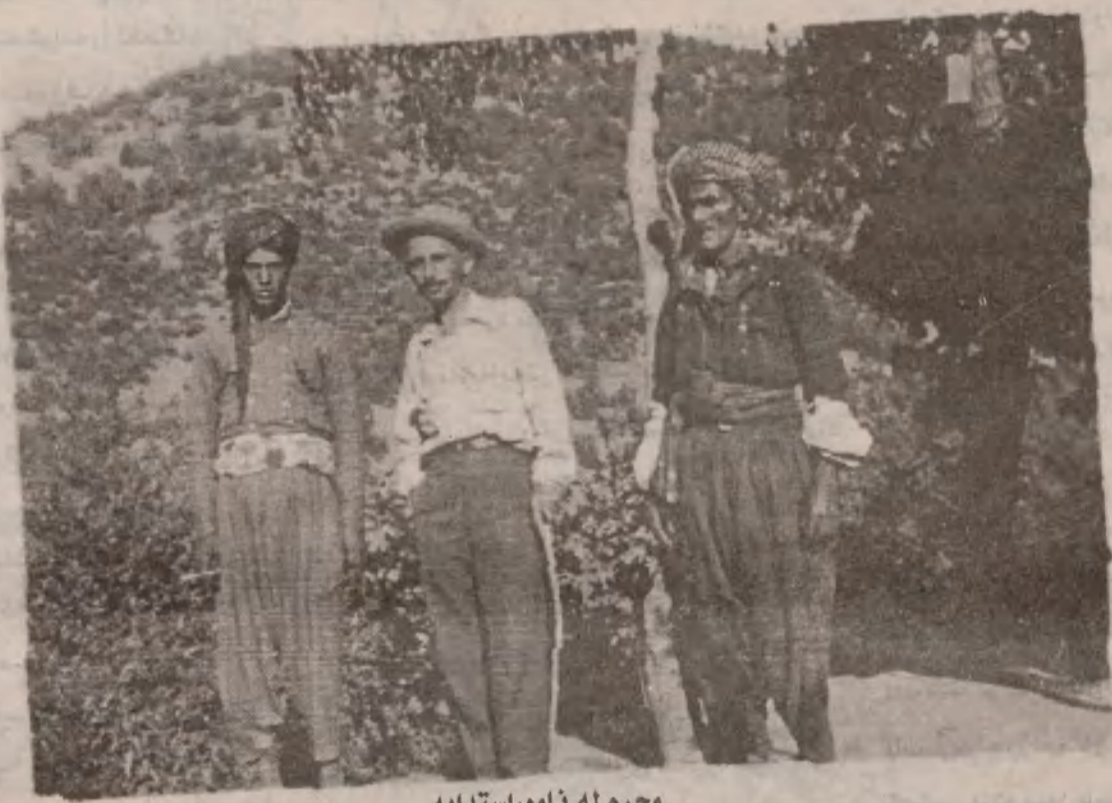
محرم له ناوهر استدايه

- په ري كي يه؟ - ناي بيغه. په ري ناناسي، په ري خان. په ري خاني ژنم. هه يه له م شاره دا نه يناسي. نه و نافره ته روح په ره قسه شرينه. كه لي م نه دا به سوله كاني نه لي ده سته گولم پيا نه كيشن. بارام بهگ به ره به ره دهنگي... به ره و نوستن نه رويشت تا به لا دا هات و كه وته پر خه پر خ به ياني كه له خه وه هه ستا سه ريك ي من و په تياره ي كردو به قه دو بالاي خويدا رواني خيرا كه وته گيرقان پشكيني خوي، له پاشا به موني كه وه سه ريك ي كردينه وه و نه راندي.