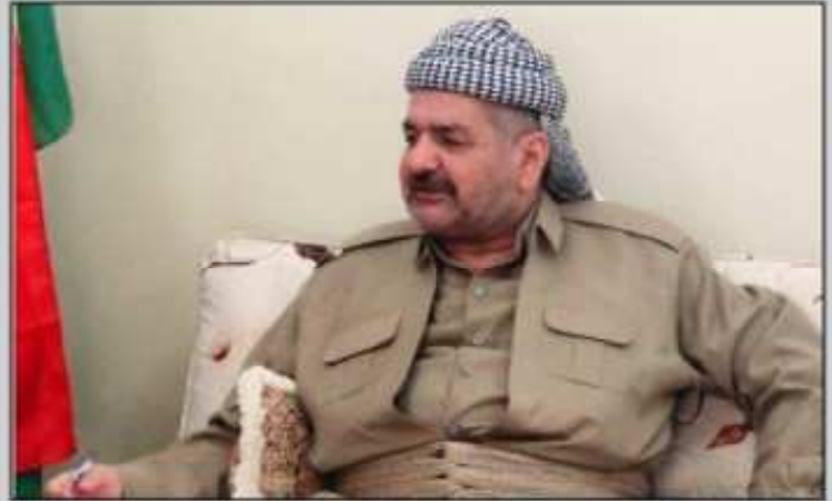
بابا دھوک ددیدارہ کا باشوردا رھنا دگریت