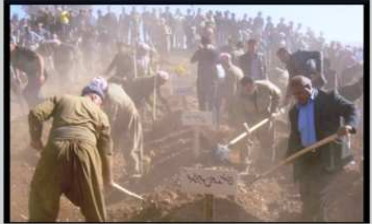
دھوک داخازا مونیومیتہ کی دگت بو نہ نفالین بہ ہدینان