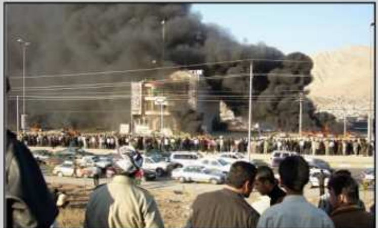
بہرپرسی مہلبندئ یہ گرتوو: نہف پارئ مہ وہرگرتی کیمہ چونکہ دشیت بارہگہ بہینہ ہہرفاندن