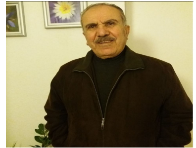
به‌رگی سه‌یهم - به‌شی هه‌شتمه/ فایلی 3.1:

به‌شی سه‌یهم: پاشماوه‌ی ژماره 13 ی تاراوگه