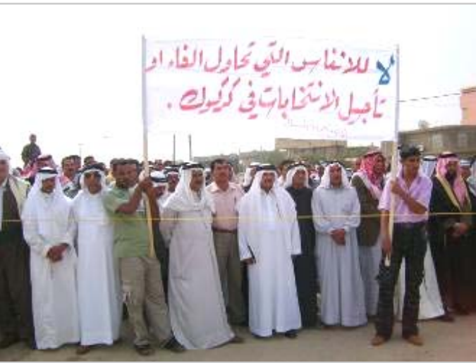
جیگای ئاماژە بۆ کردنە لەو جیگای ئاماژە بۆ کردنە لەو پێویستە هەلبژاردن لە کەرکوک

ئەنجام بدریت و بەهێج شتێوەیەک داوانە خەڕ و ئەو هەلبژاردنەش بۆ کەرکوک بە لەنگەری ئارامیی شارەکه دەزانن. جی ئاماژە پێکردنە چەندین وتار لەلایەن نوینەرانی نەتەوێکانەوه خویندکارانەوه، کە جەختیان لە برابەرەتی و تەبابی نیوان نەتەوێکانی کەرکوک دەکەردەوه هەر وەها پششتگری خۆیان بۆ ئەو هەولانە نیشاندا کە دەیانەوێت هەلبژاردنی نوینەراییەتی عێراق لە شارەکه لە کات و ساتی خۆیدا ئەنجام بدری. شایانی باسە هەندێ لایەنی تورکمان و عەرەب لە پەرلەمانی عێراق هەوڵ دەدەن کۆسپ بەخەنە رێگای ئەنجام دانی ئەو هەلبژاردنە بە پێی ووتە یەکیک لە بەشداربووانی خۆپێشاندانەکە ئەمە وەلامی ئەو لایانەیکە کە ناستەنگن لە بەردەم ئەو پرۆسە یەدا.