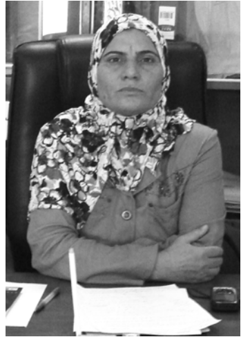
دیدار / عومەر ئاواره