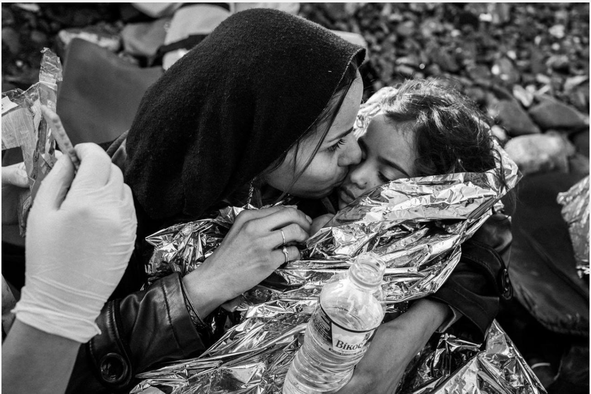
📷 Martin Gommel