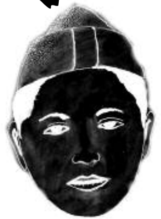
ئەم هەلبەستە ھى بوپىزى ئەمرىكى (ماك كرىا) يە