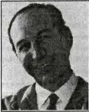
وتووێژ لە گەل: