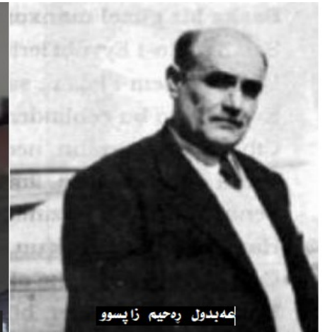
عەبدول رەحیم زاپسو

عەبدول رەحیم زاپسو شاعیر و نوسەر بوو. لە نزیکەی هەموو گۆڤارەکانی ئەو سەردەمەدا بریکی زۆر شیعری نەتەوویی و ئایینی و وتاری هەیە. تەنانەت لە ژێر کاریگەری داستان و ئەدەبیاتی میللی کوردیدا پێشینی دوو پەردەیی بە ناوی "مەمی ئالان" نووسیوە و لە "ژین"دا بلاوی کردووەتەوه. جگە لەوه، لە ئیستانبول لەگەڵ عەبدول جەودەت و عەزیز بابان و زیا گوئیگالپ لە بەلخەخانە زەرد کە سەر بە وەقفی گۆری سولتان مەحموودە، قوتابخانەی کوردییان بۆ منداڵانی کورد کردبوو. هاوکات خۆی و شیخ شەفیق ئەفەندی دوو پێشەکیان بۆ شاکاری بی هاوتای "مەم و زین"ی ئەحمەد خانە کە تا ئەو کاتە وەک دەستنوس لە تەکیە و حوجرەکان پارێزرابوو، نووسیوو و بە چاپیان گەیاندبوو.