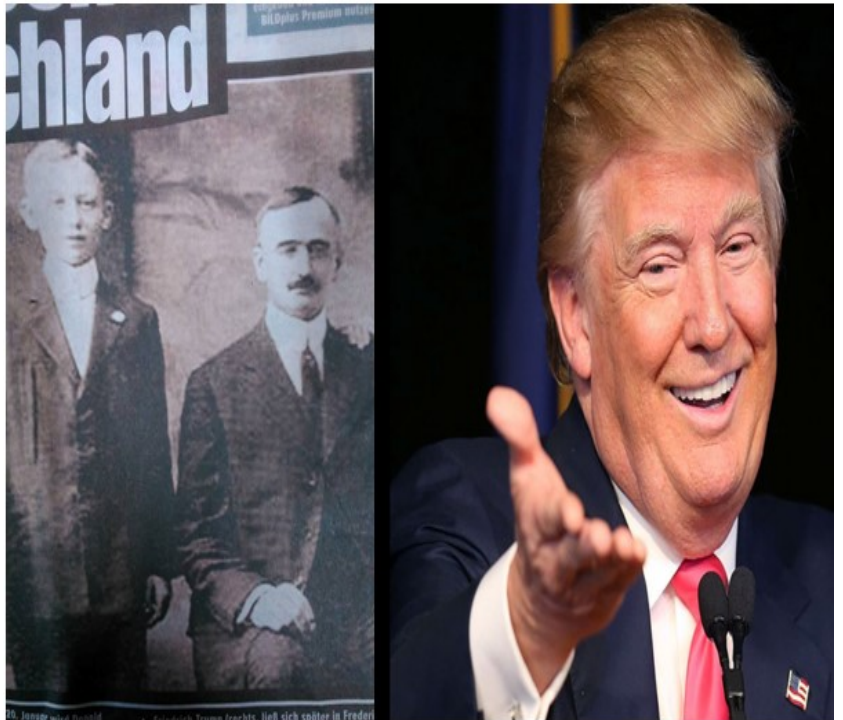
لەلايەن (ھانز-و.زاۋرە) ھو

خۇشەويستى بى ۋىنە، زاناو دادبەرۋەرى ۋلاتى باوك (خاۋەنشكۋ). بەلام لەگەل ئەۋەشدا دلى مير نەرم نايىت و بەرقى داواكى و ئەو ھەموو (تكاو ميانرەۋىي نىشاندانە) ى رەت دەكاتەۋە. بۇيە ئىدى لە 01.07.1905 ترەمپەكان بەيەكجارى ئەلمانيا جىدەھىلن. ئەمەو لە ھامبۇرگ سوارى كەشتى ھەلمى (HAPAG) ھاياگ دەبن و بەرەو پەنسلفانيا و بەئاراستەى نىۋىۋرپك رى دەكەن. لەۋسەرۋەندەشدا ئەلىساىت ترەمپ دووگان دەبىت. لەپاش سى مانگ لە (كوپنز) - لەنىۋىۋرپك - باوكى دۇنالدى ترەمپ بەدنيا دىت.