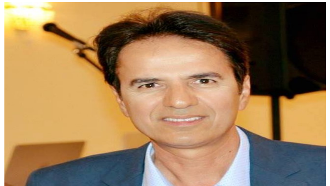
لوقمان ھەويز - تىكساس