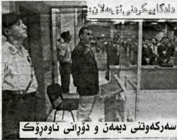
سەرکهوتنی دیمهن و دوپانی ناوهپووک