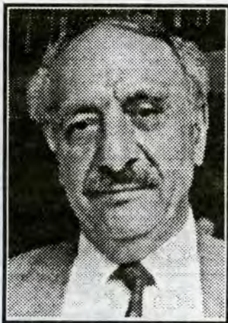
یادی دهساله‌ی شهیدبوونی سیاسه‌نامه‌داری کورد