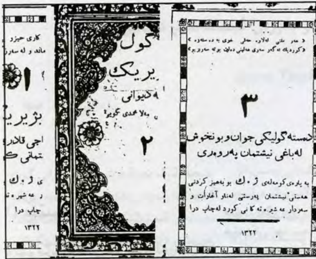
کلێشی رووبه رگی نامیلکه کانی ژماره ۱، ۲ و ۳ ی کۆمه له ی (ژ. ک)

«هوی جهنگی رابوره که جمهوریه تی تورکیا سازبوو مه حکمه یه که به ناوی «مه حکمه دی سه ریبه خویی» داندره جهنابی شیخ سه بدولقادی شهزینی و سهید مهحمه دی کوری دهگه ل هه ندی له گه و ره و ناوهارانی کوره له م مه حکمه یه ده مه حکمه کران و هه لیان ناوهمین. شینه شیخ نهحمه دی سریل ناوایی» که بیایکی به ناویانگی موکوریانه نهم شینه ی خواره و دی بۆ شه هیدانی رتگی سه ریبه سنی کوری گه راوه».