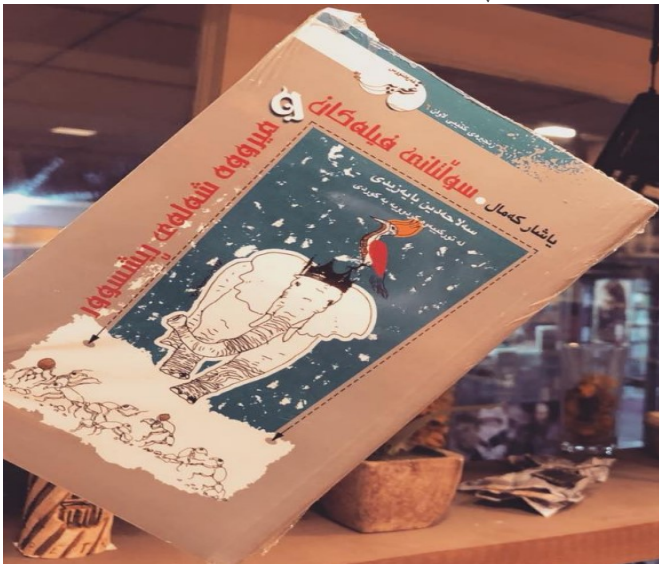
بىروانە ل 6