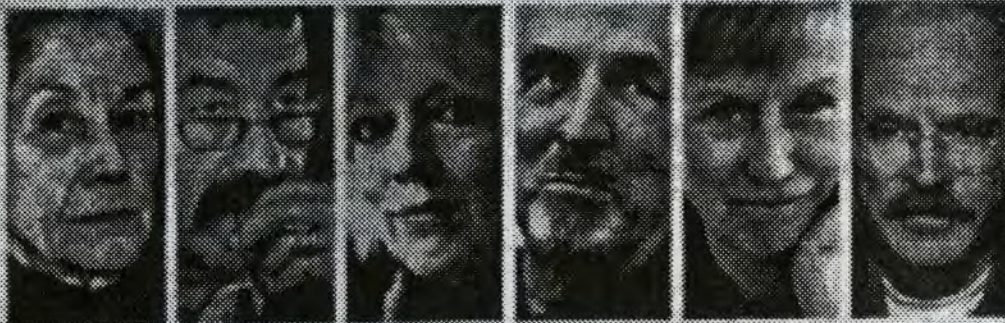
Nadine Gordimer, Günter Grass, Suzanne Brøgger, Ingmar Bergman, Kerstin Ekman och Günter Wallraff.

□ دهقی نهو بهیاننامهیه له لایهن نووسهرانی کورد، تورک و جیهانی و چهند کس له وەرگرانی خهلاتی نهدهبیی نوییل، سهبارت به مهسهلهی ماف و نازادی و دیمۆکراسی له مهەر کوردان له تورکیا، له رۆژنامهی DN (داگنس نیهیتتر: دۆشه مۆ ۱۱ نۆکتۆبری ۱۹۹۹) دا بلاوکراوه تهوه و له بهر گرینگیی ناوه رۆکه کهی، کراوه ته کوردی و لهو ژماره یه دا پیتشکیتشی خوینهرهوان دهکری. (گزینگ)