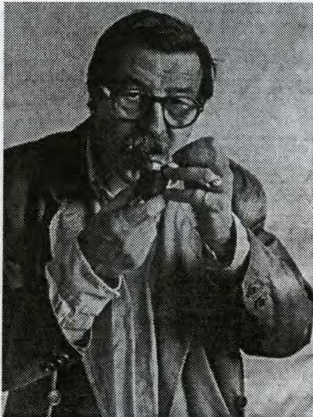
گونتیر گراس دواى بیستنی هوالی خهلاته که سهبیله که ی داده گرتیه وه

رسته یه کدا که لاله ی کردوه، ده لئ: "به بۆنه ی نه وه که له نه فسانه کانی ره شی دلگرده وینه ی روخساری فراموشکراوی میژووی کیشاوه ته وه"، نه وه خهلاته ی خه لاله ده کا.