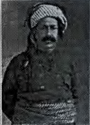
شیخ محمودی (۱۸۸۲-۱۹۵۶)

نامدوئی ژینی ئەسارت، بەسە عومری گوسرەهی نایکەمە سەر خۆم بە دەستی موددەعی تاجی شەهی قەت بە ئەسری دوژمنانم نامدوئی فەرماندەهی و شیخ محمود،