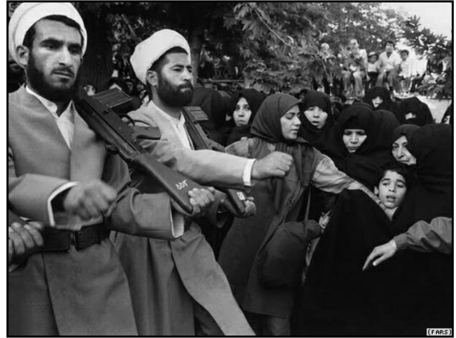
هه ژیر عه بدوئلا پوور

بۆ ئه وهى زياتر بچينه ناو كاكلى باسه كه وه و باشت ر به ناوه رۆكى بابه ته كه دا رۆچين و بهرچا و پروونيه كى باشت رمان به خوينه ر دابى، به پيوستى ده زانم كه سه ره تا چه ند پيناسه يه كى كورت له نه ته وه و ناسيوناليزم بخرينه پروو.