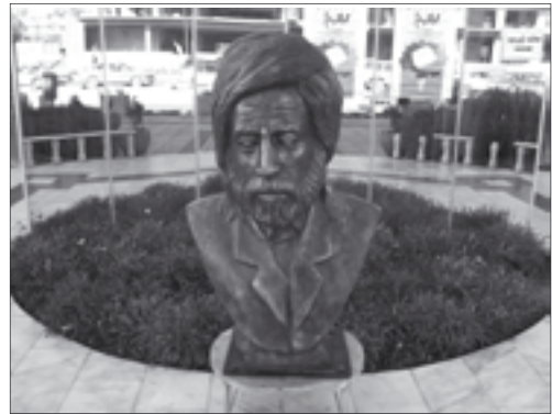
Peykerê Pîremêrd li ber Kitêbxaneya Giştî li Silêmaniyê

Di roja 27ê meha 11yê 2005an de jî Bingeha Xakê beşa çap û ragihandinê li Kitêbxaneya Silêmaniyê zêrexelata Pîremêrd li sê nivîskarên kurd belav kir. Dezgeha Xakê ji sala 2001ê û vir ve, bi navê zêrexelata Pîremêrd her sal