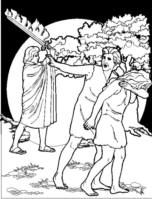
Adam û Eva ji baxê Îremê bi dûr xistin

bi sed hezeran derketin dervayî welat, xwe avêtin ber bextê welatên biyanî û li van deran star bûn, hêwirîn. Piraniya wan, milteciyên polîtîk bûn. Di cîhê peyva milteci di destpêkê de peyveke mayîn tune bû, hin kesan di nivîsên xwe de wek mîsal peyvên revok 5 û tengezar 6 bi kar anîn. Lê belê van peyvên di zimanê kurdî de zêde cîh negirtin. Di hin çavkaniyan de peyvên cîhil û derwar hatin bi kar anîn. Di dawiyê de çawa em dibînin peyva penaber zêdetir hate peyivîn û nivîsîn, wek îfadeya penaberên polîtîk . Ew kesên ku koçberî welatên xerîb bûn û xwe avêtin ber bextê van dewlatan, bi dirêjaya salan li wir man.