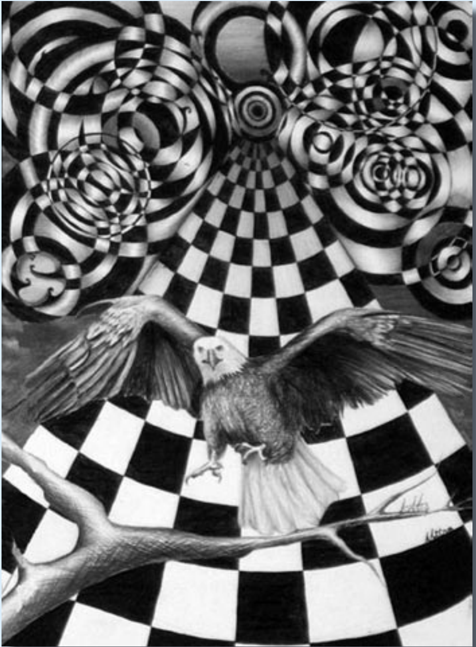
Tabloyek ji Filiz Ateş