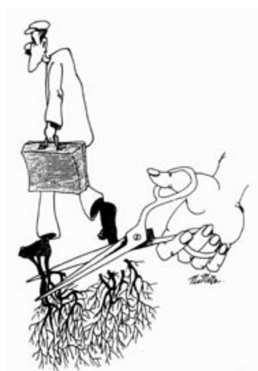
Karîkaturekî Mamoste ku sirgûne temsîl dike

Çawa tê zanîn îro bi sed hezaran kurd li welatên Ewrûpayê dijîn, li welatên xerîb û biyanî kar dikin. Di van stranên dûrî û xerîbiyê de gazin û lomeyên mezin li van welatan tîn kirin. Ji Anatoliya Navîn bi hezaran kes îro li Ewrûpayê dimînin. Di destpêka vê koçberiyê de tenê mêr diçûn, jin li van gundan de tenê bi serê xwe diman, hejmara mêran yekten kêm dibûn: