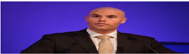
جۆرىم ۋان كلافەرن