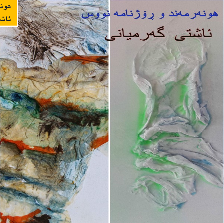
هونه رمه ند و رۆژنامه نووس ئاشتی گه رمیانی

هونه رمه ندی شیوه کاری كورد ئاشتی گه رمیانی... ل 8