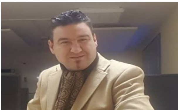
وەرگىزانى له ئەلمانىەوه: موزەفەر عەزىز

دواتر بەهاوكارى پۆليس ماشىنى فرىاگوزارى دىت و پياوەكە دەگەيەنریتە نەخۆشخانە، دەبوو سەرەتا لەژىر چاودىريدا بەيئىتەتەوه، چونكە لەبارىكى ناجىگىردابوو. ماوه بلىين ئەم خاتوونە ئەكتەر و دەرھىنەرە ئەلمانە، لەسالانى ۱۹۹۳-۱۹۹۸ بە بەرنامەى شەوانى شەممەى كەنالى ئار تى ئىل زياتر ناودارىبووه. سەرچاوه سايىتى فۆكۆس.